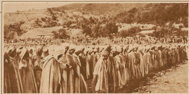
Sammlung zum Gebet am 27. Tage des Ramadân