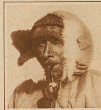
Kein Eskimo, sondern Professor DR. WEGENER

aus Graz unter dessen Leitung eine große Expedition ins Innere Grönlands unternommen wird. Die Expedition gedankt 1 1/2 Jahre auf der Eiskappe der Insel zuzubringen, wo noch nie ein Mensch überwintert hat