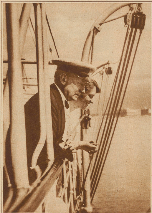
Drahtlose Uebertragung elektrischer Kraft. Dem großen italienischen Erfinder Marconi ist vorigen Mittwoch erstmals die drahtlose Uebertragung elektrischer Kraft über die gewaltige Distanz von 22.500 km gelungen. Durch den Sender seiner im Hafen von Genua liegenden Yacht «Elettra» sandte er eine elektrische Welle nach Sidney (Australien), die alle etwa 2000 Lampen im dortigen Rathaus zum Brennen brachte. Vor und nach dem bedeutungsvollen Experiment unterhielt sich Marconi radiotelephonisch mit dem Bürgermeister von Sidney; die Stimmübertragung war klar und mühelos. Das Bild zeigt den Erfinder mit seiner Frau an Bord der Yacht «Elettra»

aus Graz unter dessen Leitung eine große Expedition ins Innere Grönlands unternommen wird. Die Expedition gedankt 1 1/2 Jahre auf der Eiskappe der Insel zuzubringen, wo noch nie ein Mensch überwintert hat