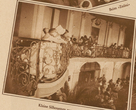
Kleine Silhouetten aus vergangener Zeit