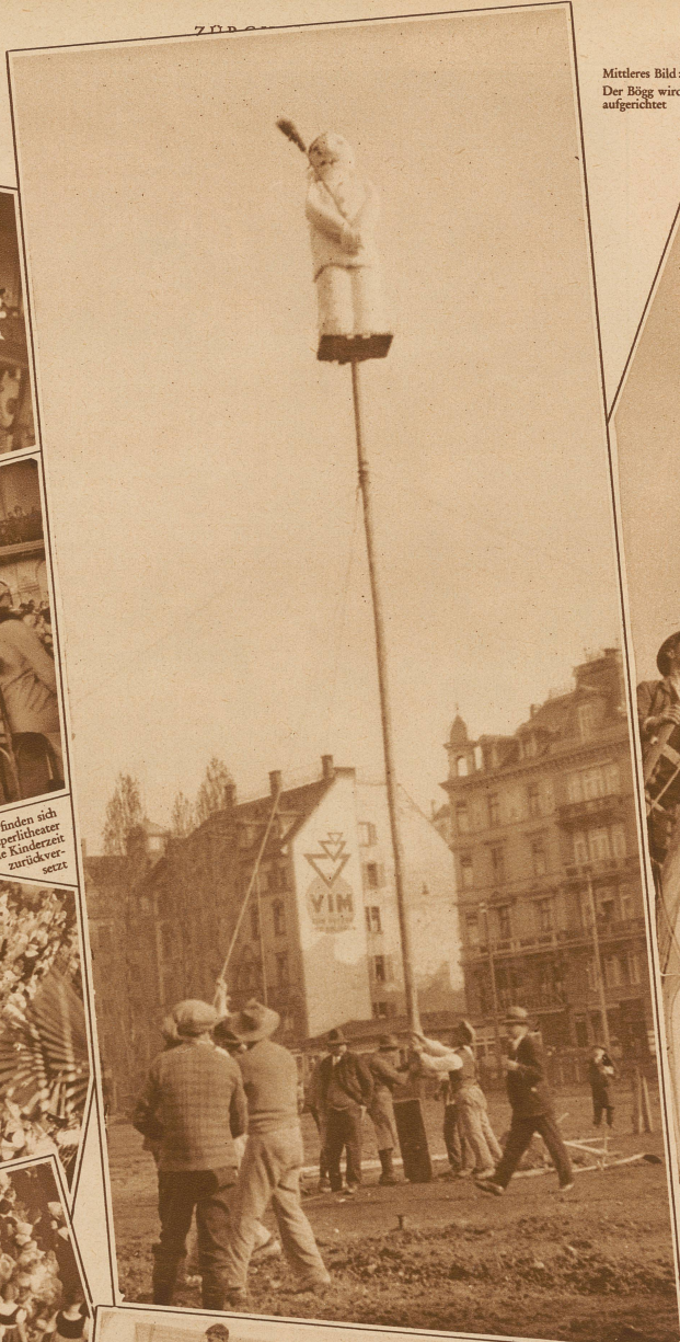
Mittleres Bild: Der Bögg wird aufgerichtet