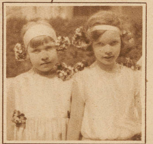
Kinder des Frühlings