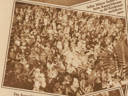
Das Kasperltheater hat großen Zuspruch