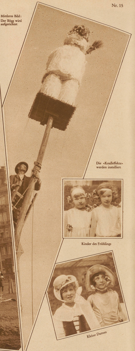
Die «Knalleffekte» werden installiert