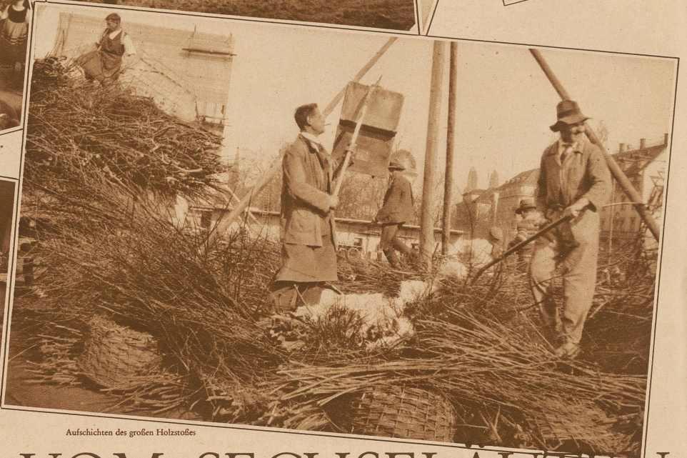
Aufsichten des großen Holzstoßes