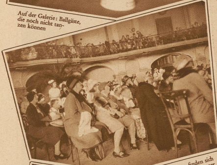
Selbst Mütter finden sich beim Kasperltheater in die Kinderzeit zurückversetzt