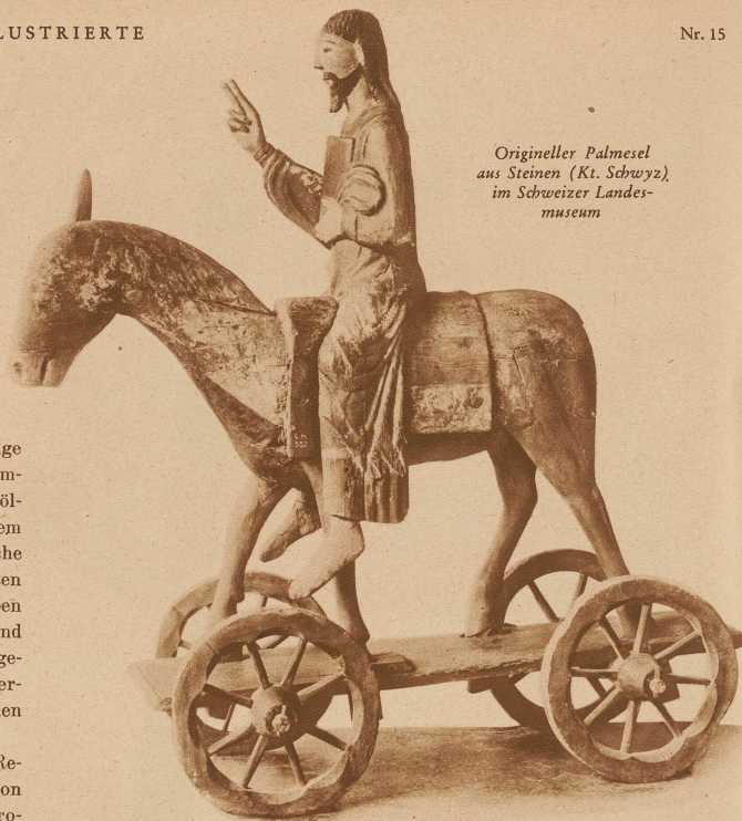
Origineller Palmesel aus Steinen (Kt. Schwyz), im Schweizer Landes- museum