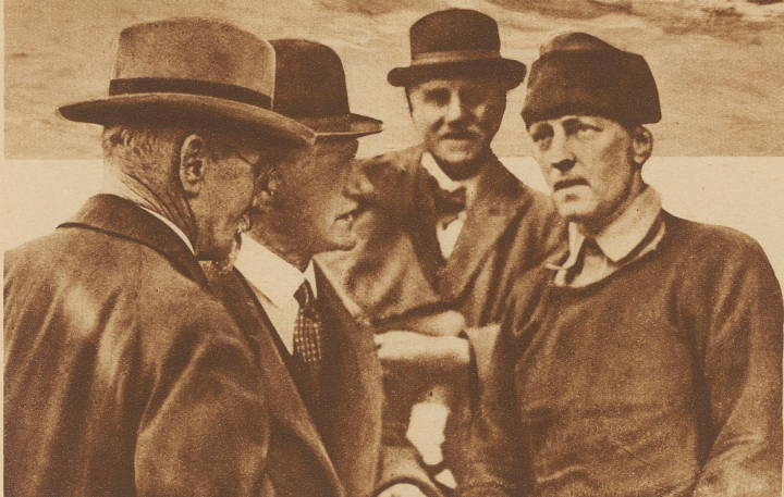
ADMIRAL BYRD (rechts) im Gespräch mit Delegierten des Empfangskomitees, das anlässlich seiner Ankunft in Neuseeland ein großes Fest veranstaltete