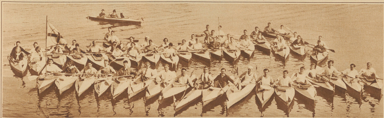
Der Faltschiffklub Zürich bei seiner ersten diesjährigen Ausfahrt

Bei dieser Gelegenheit erinnern wir daran, daß die «Zürcher Illustrierte» als einzige Zeitung der Schweiz in der Lage ist, das gesamte authentische Bildmaterial der Byrd-Expedition zu veröffentlichen. Wir hoffen, demnächst mit dem Abdruck beginnen zu können.