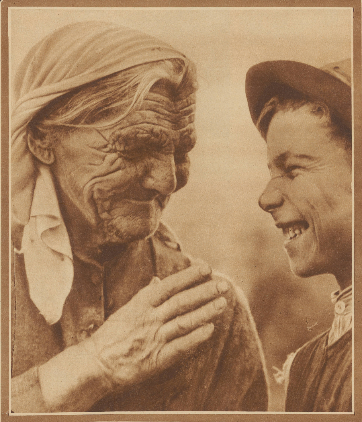
Großmütterchen erzählt den neuesten Wit