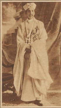
KÖNIG ALFONS VON SPANIEN

in Grindelwald starb an den Folgen einer Blinddarmentzündung im Spital in Interlaken. Er galt als einer der besten Bergführer im Berner Oberland und hat außer im schweizerischen Hochgebirge auch namhafte Touren in andern Gebirgsländern ausgeführt, so im Chamonix, Tirol, Kanada und Südamerika.