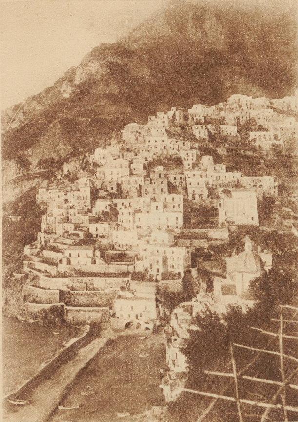
POSITANO. Steil übereinandergedrückt, die kleinen Gärthen durch Mäuerchen gestützt, erheben sich die hellen Häuser über dem sonnigen Strand

ben gerade sie das Herrlichste von Capri nicht ein. Wenn vom Monte Solaro aus mein Blick über die Insel nach Osten ging, dem Sorrentiner Meeresarme entgegen, so blieb er immer an der südlichen Küste hängen, da wo aus der Bläue des Salernitanischen Golfes die Inseln der Sirenen, die Galli, emportauchten. Dort, in eine kleine Bucht hineingeschmiegt, wußte ich mein kleines, verborgenes Paradies, ein Ziel immerwährender Sehnsucht: Positano, eine stille, kleine Stadt.