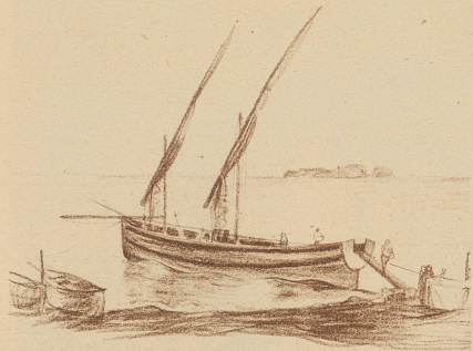
AUSLADEN EINES KLEINEN SEGLERS In der stillen Bucht von Positano

Das ist ihr Bild: Bunte Häuserwürfel, zu steilen Pyramiden übereinander getürmt. Ein Kirchturm zu oberst, eine schlanke Wetterfahne, die in den Himmel weist. Dazwischen grüne Terräßenchen, mit Wein, Oelbäumen, Limonen bepflanzt. Auf Felsvorsprüngen kleine Häusergruppen, eng um ein Kirchlein geschart. Dahinter schroff aufsteigende Felswände. Bäche stürzen darüber hinunter, ziehen Schluchten zwischen diese Häusergruppen, die man auf