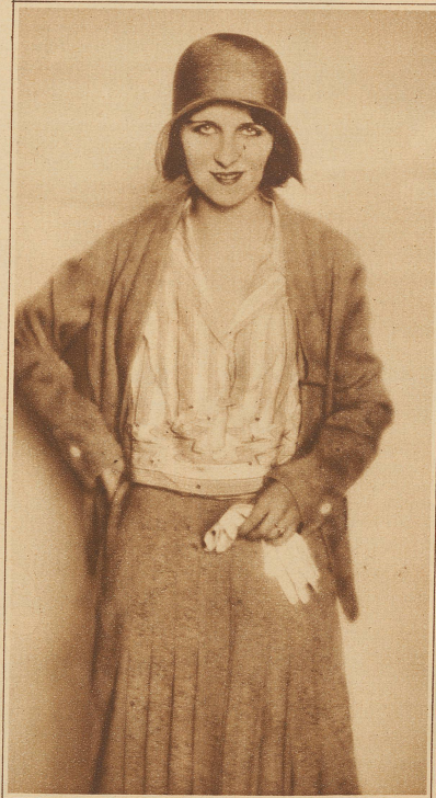
Die neue kurze Bluse

wenn vielleicht auch Frauen mehr als früher hinter ihm her sind. Aber da die Frau ihm ins öffentliche Leben nachfolgte, ließ sie auch das Wahrzeichen besorgter Häuslichkeit daheim. Sie legte die Schürze ab. Wenn Schürzen für den Mann das Interesse verloren haben, ja wenn er sie scheinbar gering achtet, soll die Frau ihn dann in der Schürze empfangen? Selbst den Arbeitsmantel, der am Vormittag ihrer Tätigkeit beruflichen Anstrich gibt, legt die Hausfrau ab und präsentiert sich dem Herrn Gemahl im schmucken Kleid. Ob er aber wirklich weniger nett wäre, wenn in gefälliger moderner Form ein Schürzengebilde das frauliche Kleid davor bewahrte, mit Suppenspritzern und Saucen in Berührung zu kommen, das käme erst noch auf die Probe an. — Man sage nicht, daß die Schürze mit der Mode nichts zu tun habe. Auch Schürzenlosigkeit ist Modesache, wenn auch negativer Art. Vielleicht kommen aber die Schürzen bald wieder. Bereits schlingen wir auf hübschen Kleidern Fichu-