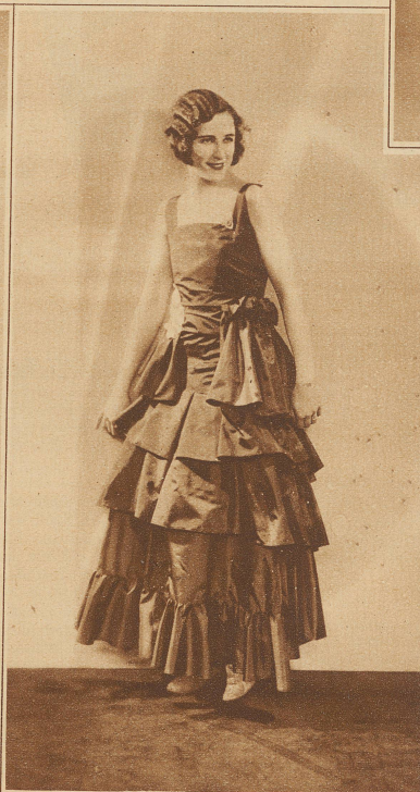
Die nächste Generation wird spotten: Als der Großvater die Großmutter nahm

aus nichts Neues. Wer kennt nicht die berühmte «Chocoladière», die im Louvre hängt! Bonnards «Dame mit Schürze» ist jedem Kunst- und Modehistoriker bekannt, und er weiß, daß diese Schürze nichts anderes war, als ein breites Spitzenvolant. Volants aber, du lieber Himmel, die traversieren in Hülle und Fülle unsere neuen Kleider in Brust-, Taillen-, Hüft- und sonstiger Schürzenhöhe.