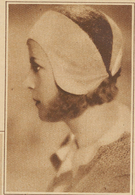
Kleidsamer kleiner Strohhut in braun und beige

wenn vielleicht auch Frauen mehr als früher hinter ihm her sind. Aber da die Frau ihm ins öffentliche Leben nachfolgte, ließ sie auch das Wahrzeichen besorgter Häuslichkeit daheim. Sie legte die Schürze ab. Wenn Schürzen für den Mann das Interesse verloren haben, ja wenn er sie scheinbar gering achtet, soll die Frau ihn dann in der Schürze empfangen? Selbst den Arbeitsmantel, der am Vormittag ihrer Tätigkeit beruflichen Anstrich gibt, legt die Hausfrau ab und präsentiert sich dem Herrn Gemahl im schmucken Kleid. Ob er aber wirklich weniger nett wäre, wenn in gefälliger moderner Form ein Schürzengebilde das frauliche Kleid davor bewahrte, mit Suppenspritzern und Saucen in Berührung zu kommen, das käme erst noch auf die Probe an. — Man sage nicht, daß die Schürze mit der Mode nichts zu tun habe. Auch Schürzenlosigkeit ist Modesache, wenn auch negativer Art. Vielleicht kommen aber die Schürzen bald wieder. Bereits schlingen wir auf hübschen Kleidern Fichu-