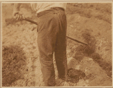
Ohne Mist keine guten Kartoffeln

kleinen oder großen, bei Weber Gottfrieds oder Schmied Ruedis, beim klugen Landwirt, der nur feldbesichtigtes und anerkanntes Saatgut bei intensiver Düngung in guten Boden steckt oder beim Kleinbauern, der unrationell wirtschaftet, — überall erhofft man zu guter Letzt Wunder von Regen und Son-