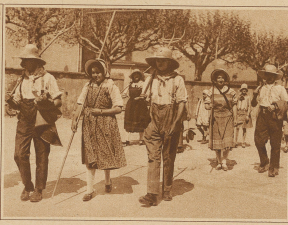
Greizer Bauer und Flechtinnen