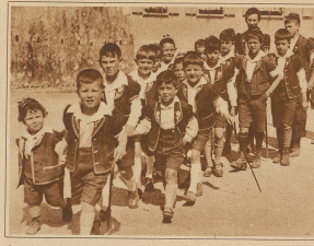
Junge Sennen im Umzug

Die vom Konservator des Greizer Museums, Dr. Hans Virel, und der im Leben gefundene Trachten-Verengung des Greizerlandes ist am Sonntag zum erstenmal mit einer größeren Veranstaltung an die Öffentlichkeit getreten. Somit die Festspiel als auch der Umgang findet beim Publikum begeisterte Aufnahme und haben ihren Zweck erreicht: Erhaltung guter Schweizer Tradition.