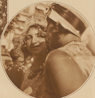
Ein herrlicher Arm, ein schöner Hut und einige offizielle Konfetti im Haar, die ist eine kleine Probe von den zahllosen hübschen Dingen, die es zu sehen gibt

Detail vom Blumenkranz: Kleine Innensicht des Wagens der Bühnen und Konditionen von Montreux, die eine Torte darstellt.