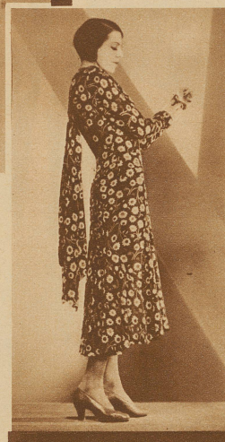
Die Margueritenwiese auf dem Nachmittagskleid. Modell Drecoll-Beer, Paris