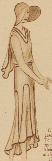
Die rundgeschnittenen Teile des duffigen Sommerkleids werden mit Schrägband eingefaßt

lung der oberen Extremitäten auch außerhalb Strandbadschranken eine reizvolle Parole, solange ihr von jugendfrischen Armen Folge geleistet wird, welche gelernt haben, sich gymnastisch schön zu bewegen. Wo aber trotz Realisierung einer Vogue für längere Handschuhe die Fleischschau beängstigend würde, da sollte die Damenwelt ein Einsehen haben und vom ärmellosen Angebot der Mode nur bei gleichzeitiger Inanspruchnahme kleiner, loser Sei-