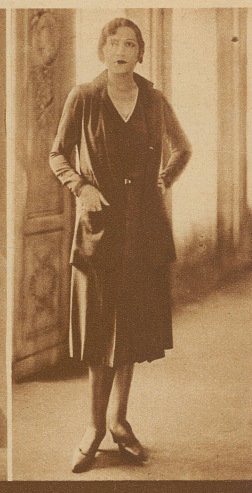
Woll-Voile ist der Wollstoff der Saison. Maison Lise, Paris, zeigt ihn hier zum flotten Frühjahrskostüm verarbeitet

Satin, Crêpe de Chine, Toile de soie oder Batist. Sie stellt bei der Farbenwahl ab auf Abstimmung oder auf Kontrast des Einfaß- und Garniturmaterials zum Uniton oder Imprimé des Kleides, Seidenjäckchens oder Schultertuchs. Schiek zu schneidern ist eine Kunst; dabei rationelle Methoden anzuwenden ist zeitgemäß.