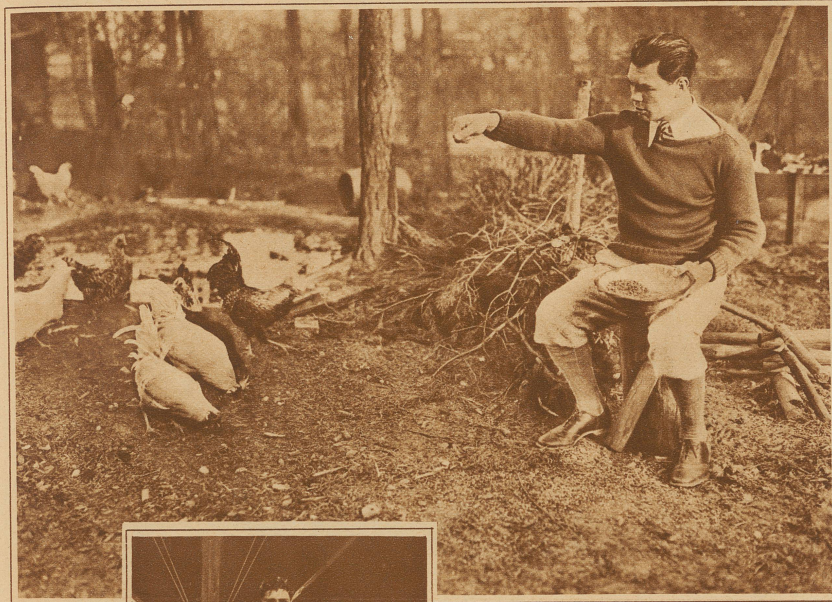
MAX SCHMELING füttert in seinem Trainingsquartier die Hühner