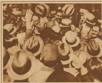
Bild rechts: Wie ein Held wird Schmeling von sei- nen Anhängern gefeiert