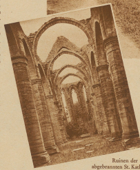
Ruinen des abgebrannten St. Nikolai-Kathedrale in Wisby

hängt wurden. Der Küste entlang aber (sonst den Blick freundliche Baderorte, deren rotes Leben und Treiben von den Schreckenatagen, die über die Insel gegangen sind, nichts mehr weiß. Den Hauptreiz bietet jedoch das Innere Wisbys. Durchschreitet man an einem Sonntagmorgen die zersplitterten, engen Straßen, wenn die Luft erfüllt ist vom Dufte der Rosen, durch hohe Mauerbögen das azurblaue Wasser der Ostsee schimmert und die Kirchenglocken mit ungewohntem Klang