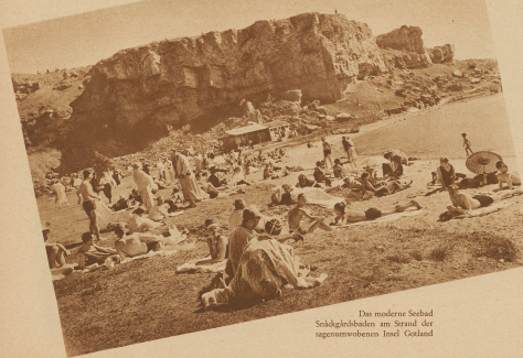
Das moderne Seebad Seebadgebäude am Strand der sogenannten Insel Gotland

Fruchtvoll war die Stadt zu ihrer Blüthezeit im 12. und 13. Jahrhundert. Die Thürme und Kuppeln ihrer 17 Kirchen ragten weithin sichtbar stolz empor, die verschiedenen Handelsnationen und Gilden besaßen stattliche Versammlungshäuser, die reichen Kaufherren hatten eigene Paläste, und im Hafen drängten sich Fahrzeuge, die ihre kostbaren Lasten von und nach fernem Ländern brachten. Aber