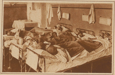
Der Andrang war eine Zeitlang so groß, daß man 3 und 4 Kinder in ein Bett legen mußte