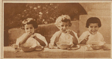
Einige Monate gewissenhafter Pflege gaben den unglücklichen Kindern ihr natürliches, gutes Aussehen zurück

Die Near East Relief Society hatte sich aber in den ersten Jahren nicht nur mit den Kindern zu befassen, sondern sie mußte sich ebenso sehr um die Erwachsenen kümmern, die hilflos das Land durchstreiften. Die Waisenhäuser waren lange Zeit hindurch die einzigen Stellen für den Postverkehr und für