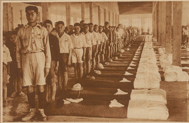
Schlafsaal in einem Heim in Syra, einer Insel im Aegäischen Meer

Es gab einen Augenblick, wo das heutige Griechenland mit seinen 5 Millionen Einwohnern elend und erschöpft darniederlag, und in dieser denkbar