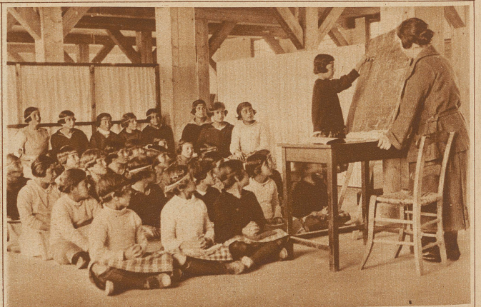
Klasse einer Waisenschule