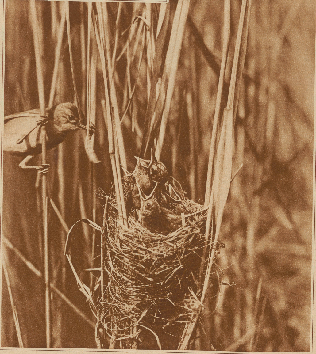
4 kleine Rohrsänger, die glücklicherweise keine Waisenkinder sind

Heute ist das Schlimmste überstanden. Die Gesellschaft kann sich ausschließlich ihren 132,000 Kindern widmen, die ihre Waisenhäuser bevölkern. Sie werden gepflegt, erzogen und zu Berufen herangebildet, die für die Bewohner der ältern Generation keine direkte Konkurrenz bedeuten. Wissenschaftlich ausgebildete Bauern, Dorfschullehrer, Mechaniker, Elektriker, Maurer, Daktylographinnen, Kindergärtnerinnen, Chauffeure usw. sind einige dieser Berufe, die schon an sich geeignet sind, das wirtschaftliche Niveau des Landes zu heben, neuen Bedarf, neue Produktionsmöglichkeiten zu schaffen und auf diese Weise zur Besserung der allgemeinen Lage der Gesamtbevölkerung beizutragen.