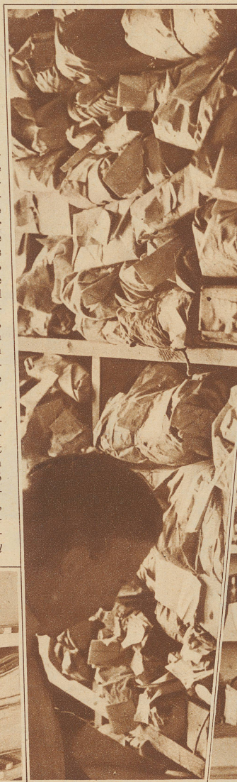
Wäsche wird in Bündel verpackt und auf großen Gestellen aufgestapelt