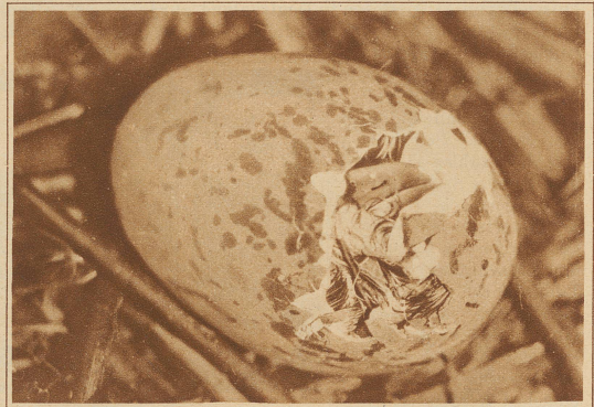
Ausschlüpfende Möve. Man sieht den Schnabel mit dem Eizahn, der zum Durchfeilen der Schale dient

Um jederzeit für die Aufnahmen bereit zu sein, richtete sich die Arbeitsgruppe in einer improvisierten Unterkunftshütte am Rande des Schutzgebietes