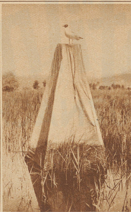
Das Photozelt. Die Möven sind sonst sehr mißtrauisch und stürzen sich gut, wenn ein Mensch das Zelt betreten hat. Da sie offenbar nicht auf zwei zählen können, so sind sie befriedigt, wenn eine Person das Zelt wieder verläßt, selbst wenn vorher mehrere Personen gleichzeitig darin verschwunden sind