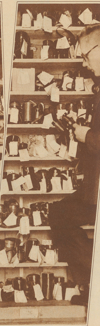
Feldstecher und Operngläser en gros — alles im Leihhaus Phot. P. & A.