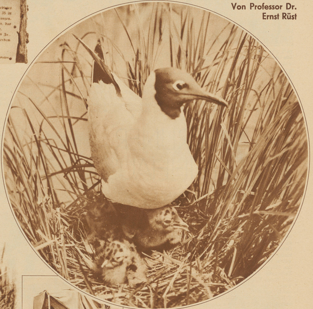
Lachmöve mit Jungen

Bild links: An der Arbeit im Kinozelt. (Das Zelt ist hier geöffnet, um das Innere zu zeigen.)