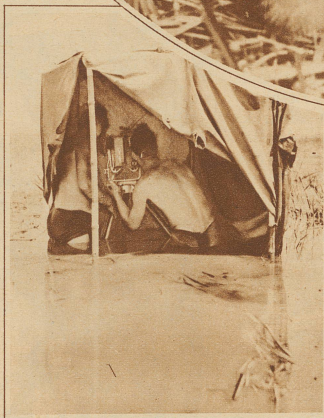
Bild links: An der Arbeit im Kinozelt. (Das Zelt ist hier geöffnet, um das Innere zu zeigen.)

tes ein. Morgens in aller Frühe ging's durch die taufrischen Wiesen zum kalten Bad (8° C) in der Linth. Das schützte gegen Erkältungen, denn die Aufnehmenden standen bis zu 10 Stunden täglich im Wasser. Daß sie dabei