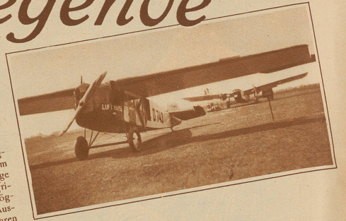
Auf dem nahen Flugplatz von Amsterdam stehen die Flugzeuge bereit, um die frischen Blumen möglichst rasch ins Ausland zu führen