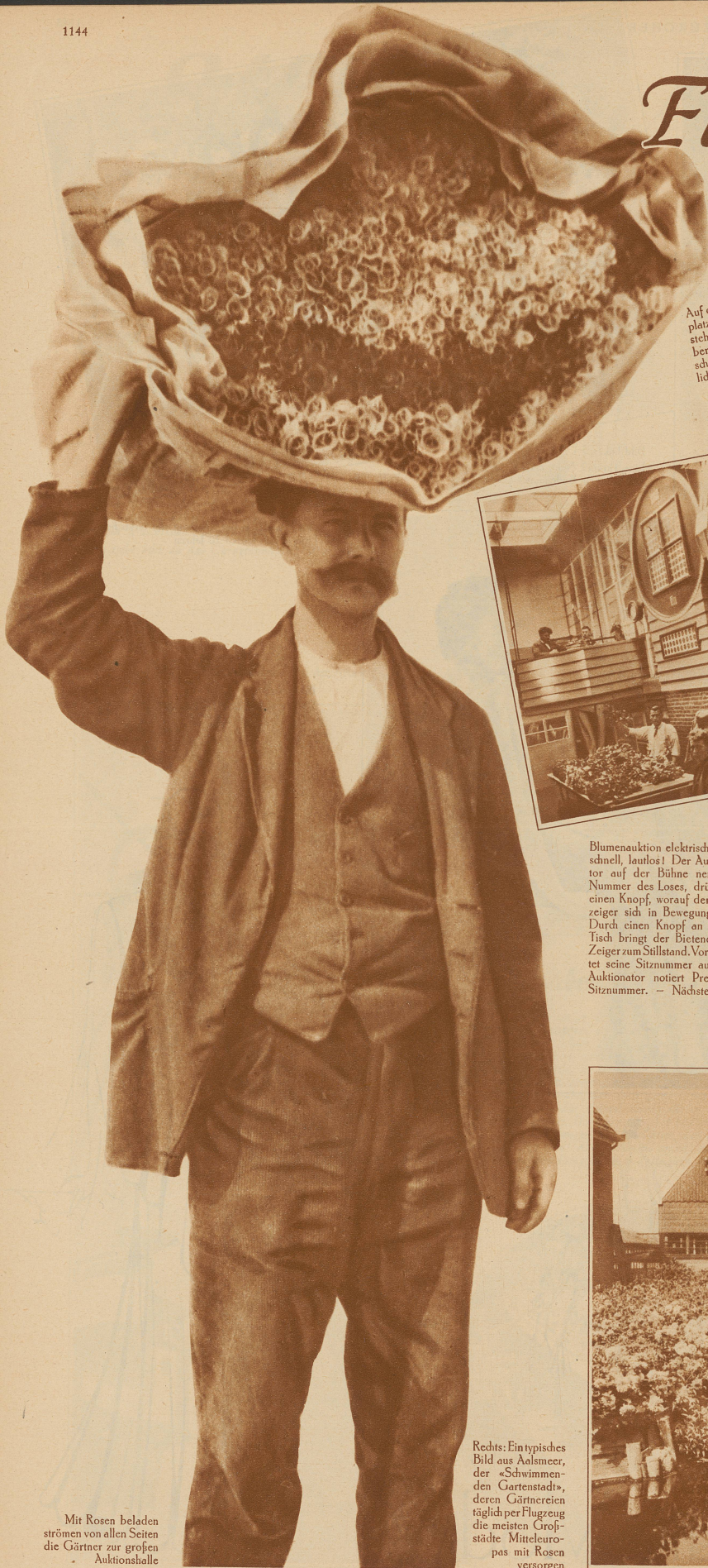
Mit Rosen beladen strömen von allen Seiten die Gärtner zur großen Auktionshalle