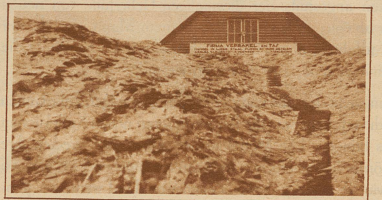
Ganze Berge von Glasscherben türmen sich vor den großen Blumenzüchtereien auf. Die Scherben werden wieder eingeschmolzen