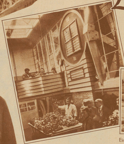
Blumenauction elektrisch, blitzschnell, lautlos! Der Auktionator auf der Bühne nennt die Nummer des Loses, drückt auf einen Knopf, worauf der Preiszeiger sich in Bewegung setzt. Durch einen Knopf an seinem Tisch bringt der Bietende den Zeiger zum Stillstand. Vorn leuchtet seine Sitznummer auf. Der Auktionator notiert Preis und Sitznummer. - Nächstes Los!