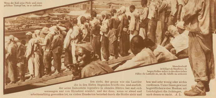
Menschen sind billiger als Maschinen in hegen Ferkeln stehen in den chinesischen Häfen die Lasten zu, um die Schiffe zu entladen

schließlich in diesem oder jenem Winkel wie ein Hund stirbt, ist mit das gefährlichste gährende Element, das sich in China zu diesen wohlorganisierten Banden unter dem Befehl irgendeines mächtigsten Generals zusammenruft, plündert, Städte in Brand steckt, Europäer verschleppt und sie nur gegen heftiges Lösegeld freigibt. Kuli ist im eigentlichen Sinne des Wortes der chinesische Tagelöhner, der Bettler, der Arbeitslose, der Gelegenheitsarbeiter, die ohne Ausnahme alle ganz kleine Bedürfnisse