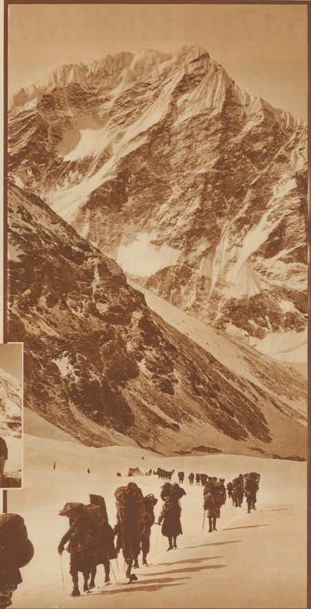
Das Hochlager II Nord (6000 m) gegen die Nordwand des Kangchenjunga Peak

rend der ganzen Expeditionsdauer unter den Mitgliedern das beste Eilvernehmen und eine ausgezeichnete Kameradschaft herrschte, trotz der Zeitverteilung zu verschiedenen Nationen. So hat die I. H. E. einen kleinen, aber durchaus positiven Beitrag zum Kapitel des gegenseitigen Verständnisses unter den Völkern geliefert.