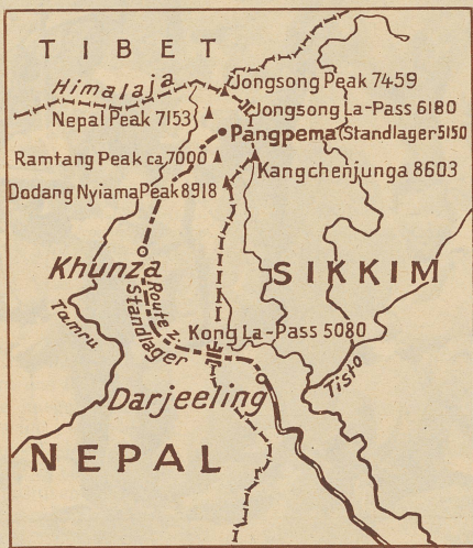
Kartenskizze der Himalaya-Expedition. Die gestrichelte Linie bezeichnet die Grenzen zwischen Sikkim, Nepal und Tibet, die strichpunktierte den Weg der Expedition von Darjeeling über Khunza zum Standlager Pangpema. Die beiden Flüsse fließen nach Süden zum Ganges. Darjeeling ist durch eine Eisenbahn mit Kalkutta verbunden. Die Grenze zwischen Nepal und Tibet führt nach Westen über den Mount Everest