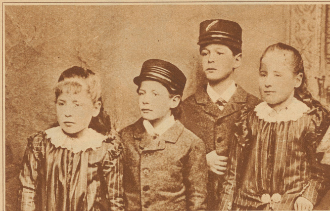
5 6 7 8