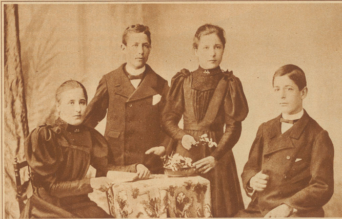
1 2 3 4