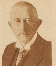
Prof. Georg Wegener Leiter der dieses Frühjahr ausgefahrenen Grönland-Expedition, von der man seit Monaten ohne Nachrichten ist und deshalb große Besorgnisse um sie hegt