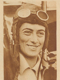
Auch die bekannte englische Fliegerin