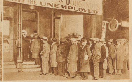
Der Schmugglerkönig als Wohltäter. Al Capone, Chicagos gefühligster Bandenführer, hat eine Suppenküche eingerichtet, in der 3500 Arbeitslose täglich kostenlos verpflegt werden. Diese Propaganda kostet ihn täglich 3000 Dollar – aber sie scheint das wert zu sein. Das Bild zeigt, wie Arbeitslose vor einer der Suppenküchen Al Capones auf Eintritt warten