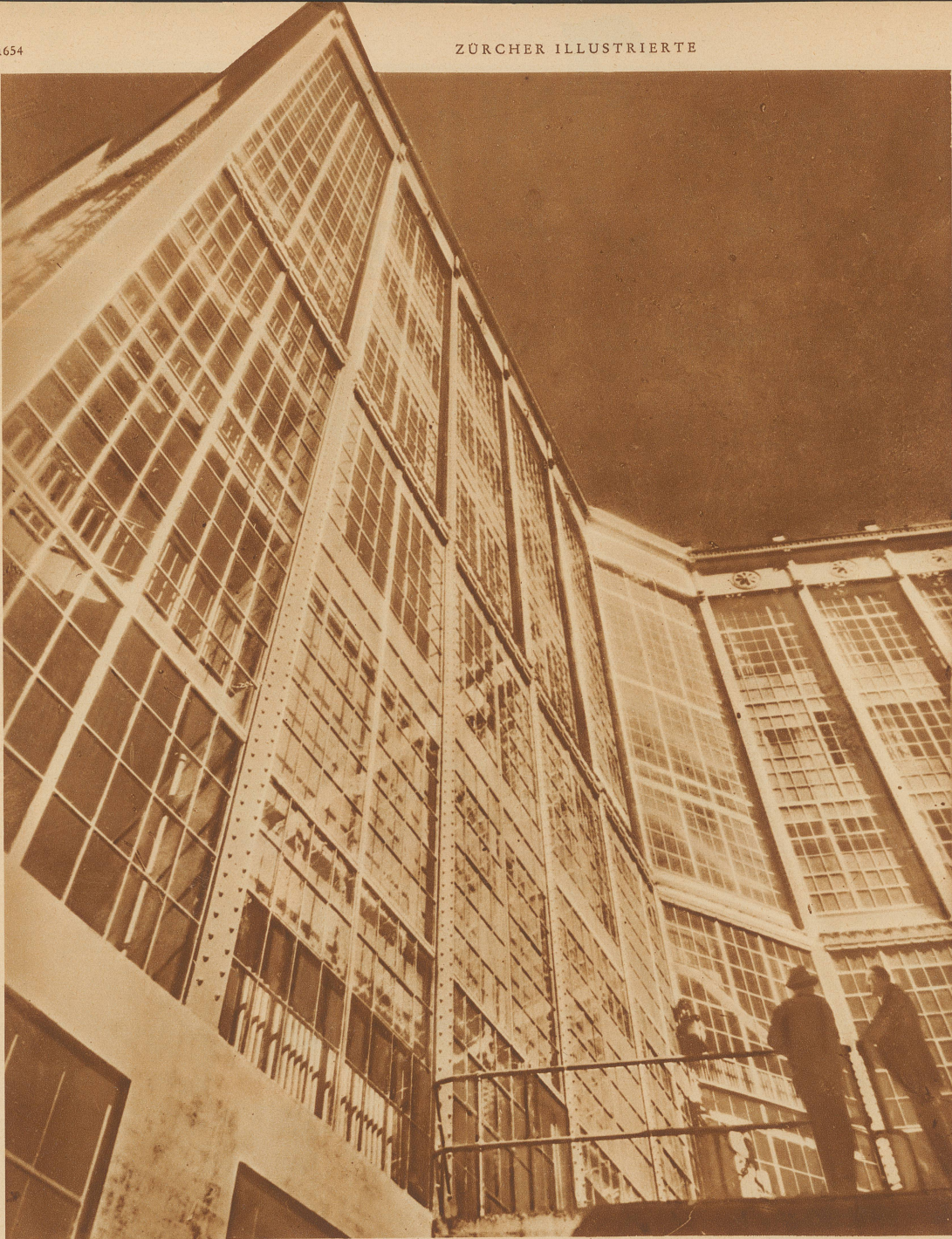
Ein Haus aus Stahl und Glas ist kürzlich in Worcester (U. S. A.) fertiggestellt worden. Auch nicht die kleinste Mauer ist zu sehen. Dadurch erhalten die Innenräume dieses reinen Zweckbaues, der deswegen nicht unschön zu sein braucht, eine bisher nicht gekannte Lichtfülle. Das Gebäude enthält die Verwaltungsräume eines großen Eisen- und Stahltrustes, der auf diese Weise für seine Produkte Reklame macht