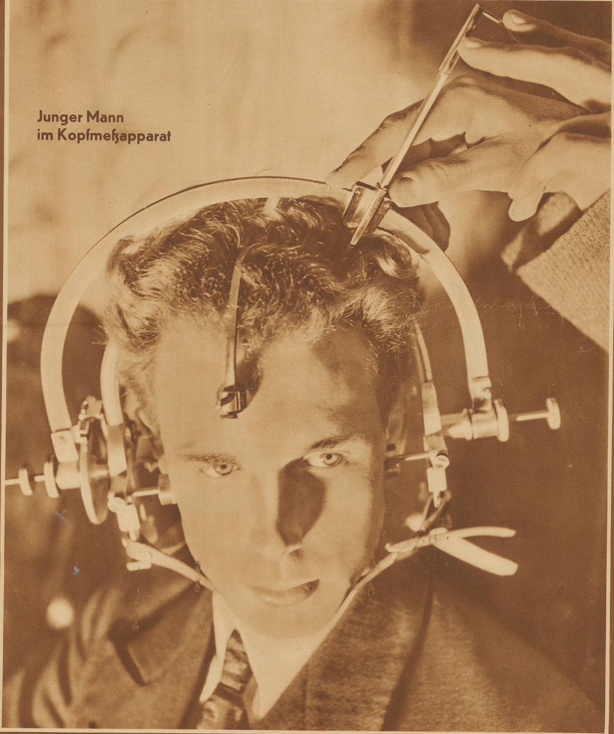
Junger Mann im Kopfmessapparat