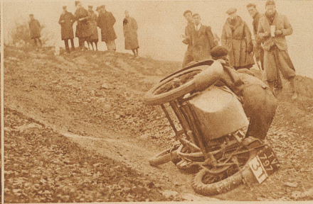
Nirgends werden bei Motorradrennen so hohe Anforderungen gestellt wie in England. Meist sind es Querfeldeinrennen, bei denen Stürze besonders häufig, aber nur selten gefährlich sind, da keine großen Geschwindigkeiten gefahren werden können. So auch in unserm Bilde, wo der Fahrer seinen Sidecar mitsamt dem Passagier wieder aufstellt und weiterfährt