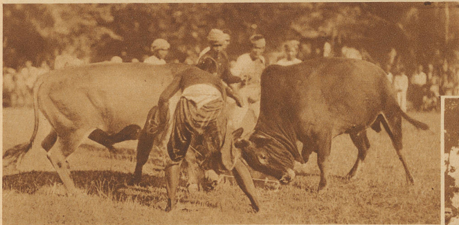
Zwei kämpfende Stiere. Auf den Sieg des schwarzen hatte der Sultan 1000 Pesos gewettet — und verlor

ger Mann mit einem roten Fez auf dem Kopfe und einem Spazierstock in der Hand. Jetzt konnten die Kämpfe beginnen. Zwei mächtige Stiere wurden an Nasenringen in die Mitte der Arena geführt. Der eine braun, der andere schwarz. Auf den Sieg des Schwarzen hatte der Sultan 1000 Pesos gesetzt. Kaum hatten die Tiere sich gegenseitig erblickt, senkten sie ihre Köpfe und sprengten mit ungeheurer Wucht aufeinander los. Es gab einen widerwärtigen, dumpfen Schlag, als ihre Schädel zusammenkrachten und man glaubte, die Knochen und Muskeln auseinander-gesprengt zu sehen. Wolken von Staub wurden von den wütend brüllenden Tieren aufgewirbelt. Das Volk raste vor Vergnügen und Erregung. Bald hatte der schwarze Stier die Oberhand, bald wieder der braune. Dann plötzlich, sehr zum Aerger für alle diejenigen, die auf ihn gewettet hatten, brach der schwarze den aussichtslosen Kampf ab, wendete sich