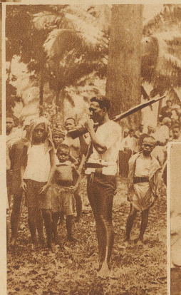
Ein Moro-Polizist mit geschultertem Gewehr