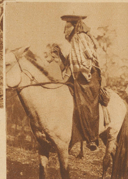
Die Lieblingsfrau des Sultans kommt hoch zu Pferd zu den Stierkämpfen

Die den Frauen und Kindern reservierte Tribüne, die rings um den Kampfplatz führt. Gerade bequem sind die Sitze auf den Bambusstangen nicht