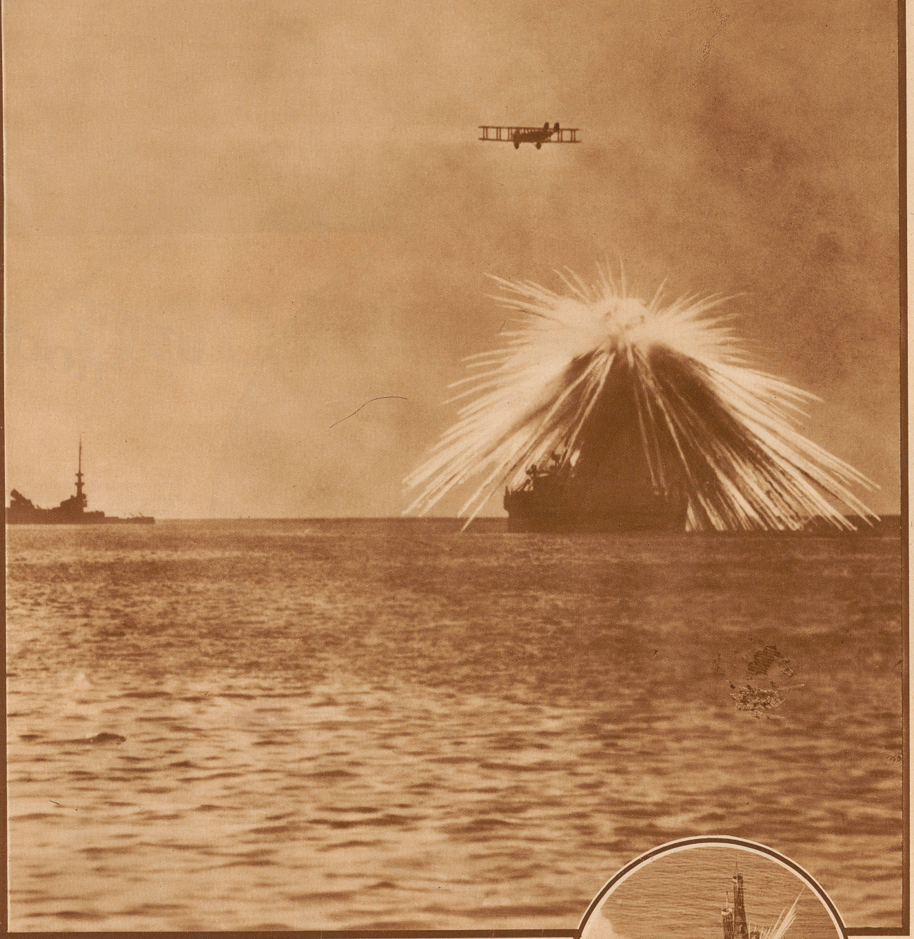
Explosion einer Phosphorbombe in den Masten

Der gefährlichste Gegner für die Flotte ist heute das Flugzeug. Zum erfolgreichen Angriff auf eine Wasserfläche von zehn Quadratkilometer werden 720 Tonnen Bomben berechnet, die von 480 Flugzeugen getragen werden können. Um also eine Fläche wie die der Straße von Gibraltar wirksam mit Bomben zu belegen, genügen 110 Flugzeuge. Da die Treffsicherheit aus einer Höhe von 5000 bis