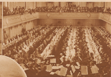
Etwa 300 Veteranen. Ein- und ein halbes Tüchlein im Berner Kasino nach 60 Jahren wieder zusammen