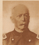
General Herzog, der Führer der schweiz. Armee während der Grenzbesetzung 1870/71

nach dem Friedensschluß wieder nach Frankreich zurückkehren konnten. Noch heute erzählen die Großväter von den bleichen, abgezeichneten Gestalten in den weiten roten Hosen, und noch manche Großmutter erinnert sich, wie sie aus Leintuchresten Charpie zupfte für die Verwundeten und in einem Kessel warme Suppe und Brot den Internierten zutrug.