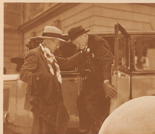
Vor 60 Jahren wie es «erregt» gegangen, wenn es schon Anzug gegeben hätte

Sonderausnahmen für die «Zürcher Illustrierte» von P. Senn