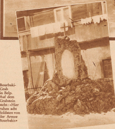
Bourbaki-Grahl in Belp. Auf dem Grabstein sieht man die Soldaten von der Armee Bourbaki's

Zustand kamen Türkos, Zuaven und Franzosen aller Waffengattungen, wurden von den Grenzbesetzungstruppen entwaffnet und im ganzen Lande zur Internierung verteilt. Aufopfernde Pflege – besonders der vielen Kranken – und weitgehende Hilfsbereitschaft brachten es zustande, daß mit Ausnahme von 1700 Mann, die in der Schweiz starben, die meisten