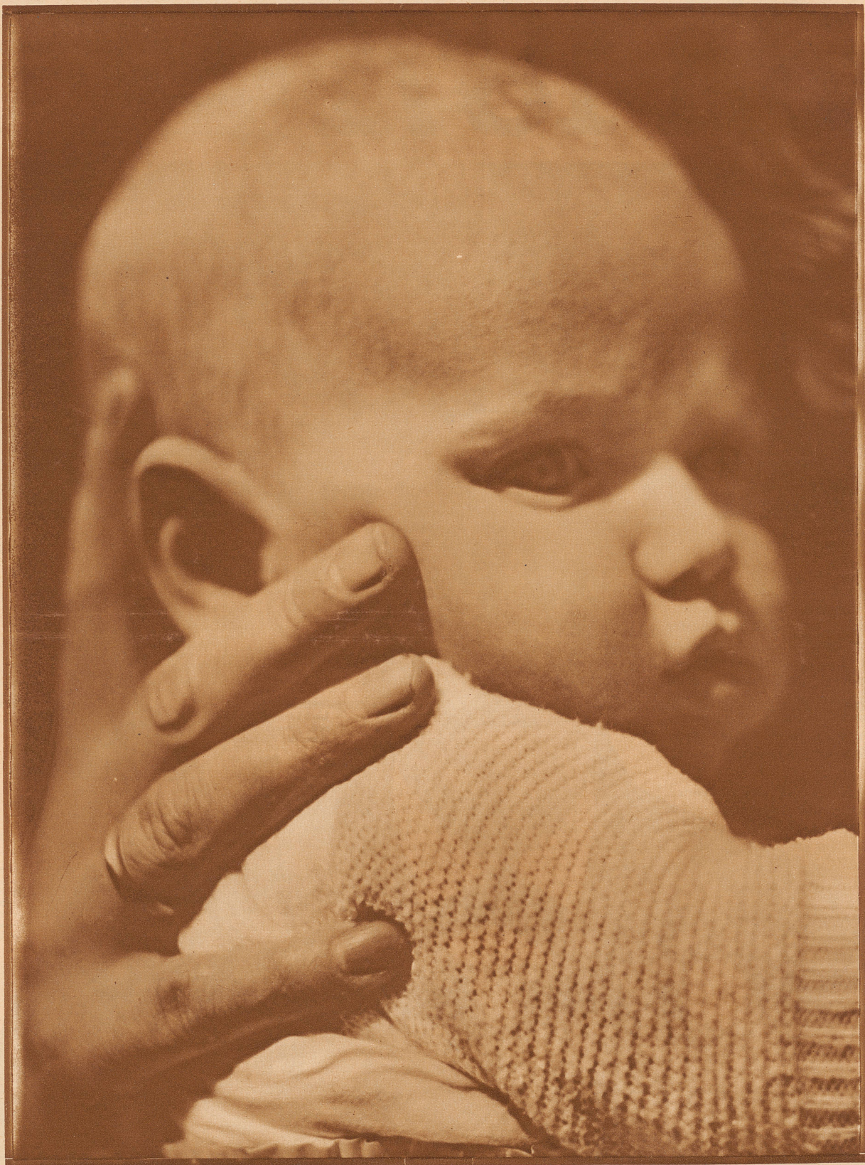
Phot. Hedda Walther Aus «Mutter und Kind» Verlag Dietrich Reimer, Berlin

«Vom sichern Port läßt sich gemächlich - staunen . . . »