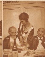
Als man zum letzten Male beisammen war, all man aus dem Gemeindefest der Oedmannen