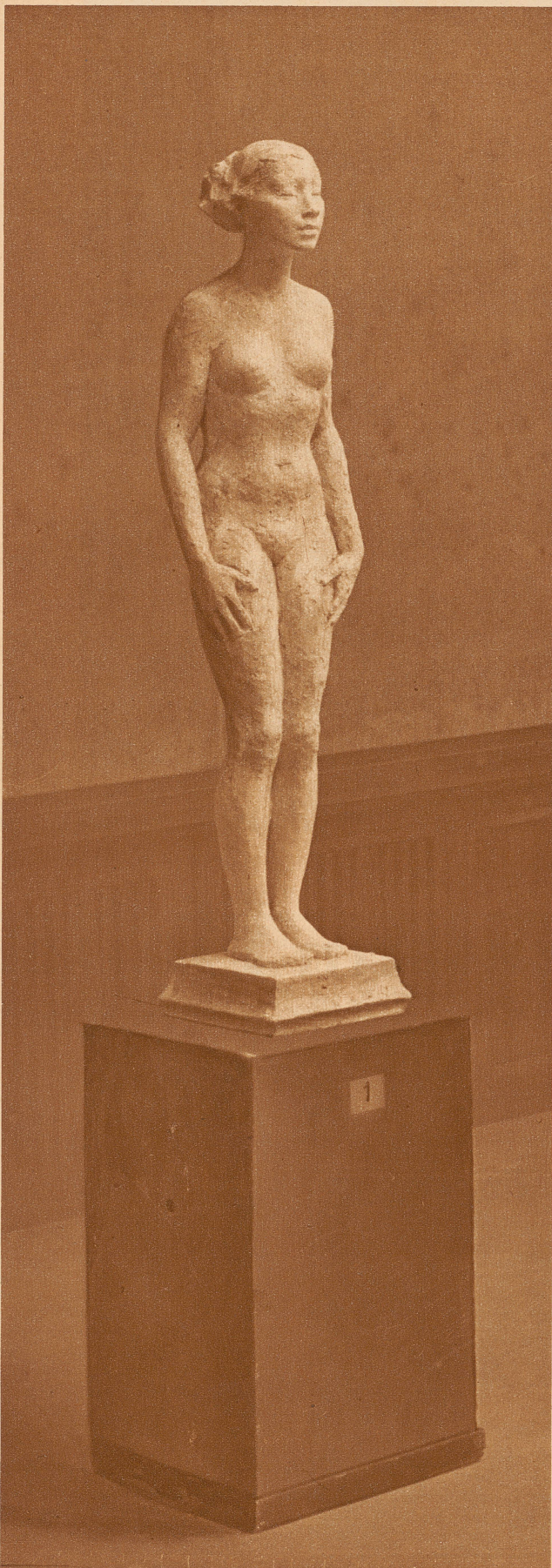
Links nebenstehend: Eine lebensgroße Frauenfigur aus der Haller-Ausstellung, die das Zürcher Kunsthaus im letzten Herbst veranstaltete

typus geworden, der schlanken, hochaufgereckten Frauen, deren Glieder lang, schmal und fest sind. Mir kam seine Kunst vom ersten Augenblick an wie neues Griechentum vor, nur individueller, eigenwilliger, moderner — unserm jetzigen Leben und allem, was uns freut, unendlich nahe.