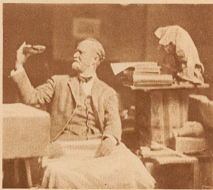
Der kritische Blick auf das halbfertige Modell

steht, wo dem sell ma lieber möglichscht wenig säge.» Ich bleibe ungerührt — denn liebt er die Presse nicht, so liebt doch die Presse ihn. Ich weiß genau, daß er recht hat, wenn er sich auf seine Arbeit konzentrieren will und die vielfältige Umwelt nur in geringem Maße an sich heranläßt —, und ich weiß, daß ich recht habe, wenn ich alles wissen und sehen und anderen davon erzählen will. So