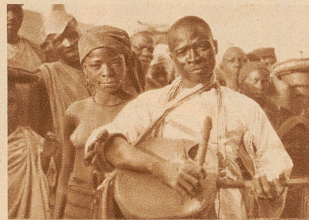
Fahrender Lautensänger aus Kano