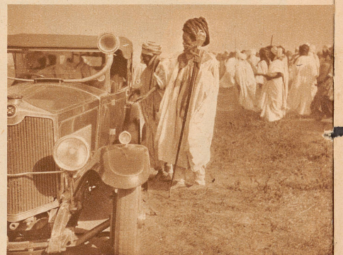
Das Auto des Emirs von Kano. Diesem einheimischen Negerfürsten lassen die Engländer, die Herren Nigeriens, einen Schein von Macht. Sie zahlen ihm auch eine jährliche Rente von 300 000 Schweizerfranken, die aber nur knapp für den Haushalt und für die 100 Frauen ausreicht. Der elegante Rolls Royce nimmt sich zwischen den Lehmhäusern und im Staub der Straßen sehr merkwürdig aus