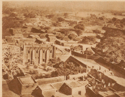
Bild rechts: Der Lehmipalast des Emirs von Kano. Auf ausdrücklichen Wunsch des Fürsten führte ich ihn im Tiefflug nur wenige Meter hoch über sein Schloß hinweg. In den zahlreichen Höfen standen und winkten seine mehr als hundert Frauen, die Eunuchen taten das gleiche, indessen draußen in der Stadt eine viel-tausendköpfige Menge sich drängte, jubelte und schrie und nach unserer Maschine sah, mit der ihr geistliches und weltliches Oberhaupt in den Himmel gestiegen war