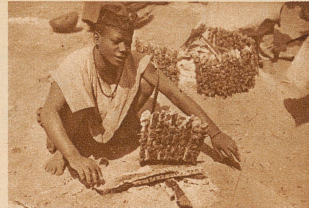
Alles auf der Straße. - Fleisch am Spieß frisch gebraten gefällig?