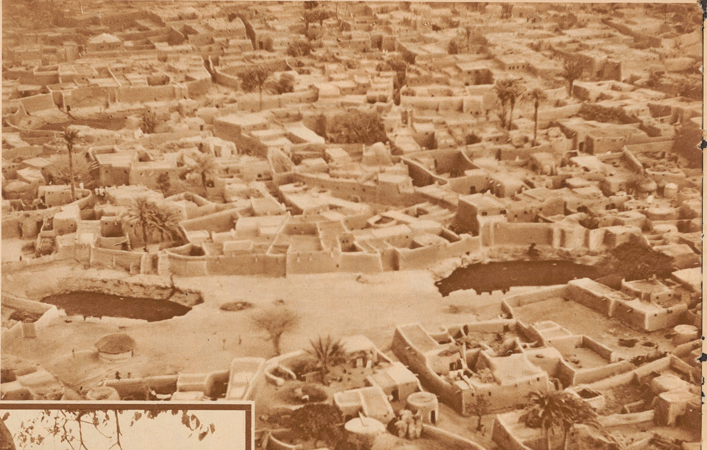
Kano, die Hauptstadt Nigeriens. Von Gao am Niger sind wir in acht ununterbrochenen Flugstunden hieher gekommen. Die Stadt hat ungefähr eine Flächenausdehnung wie Bern und ist mit einer 3-6 Meter hohen Lehm-mauer umgeben. Es ist schwer, sich in den Straßen zurechtzufinden. Die hohen Lehmwände und Mauern beengen die Sicht