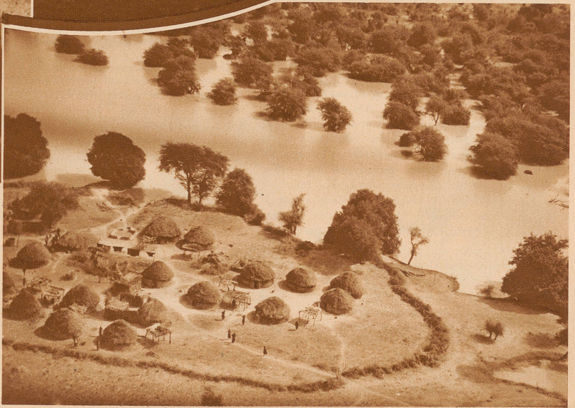
Bild rechts: Eingeborenen-dorf am Tschadsee. Die Dörfer sind schwer zugänglich, sind zum Teil auf Pfählen gebaut und zu Zeiten rings von Wasser umschlossen. Hierher haben sich zu Zeiten der Sklavenjagden der Araber die Ureinwohner des Landes geflüchtet

Hausa-Mädchen verkauft Bananen. Es gehört zu den Schönheiten Afrikas, daß man so vielen lachenden und zufriedenen Gesichtern begegnet