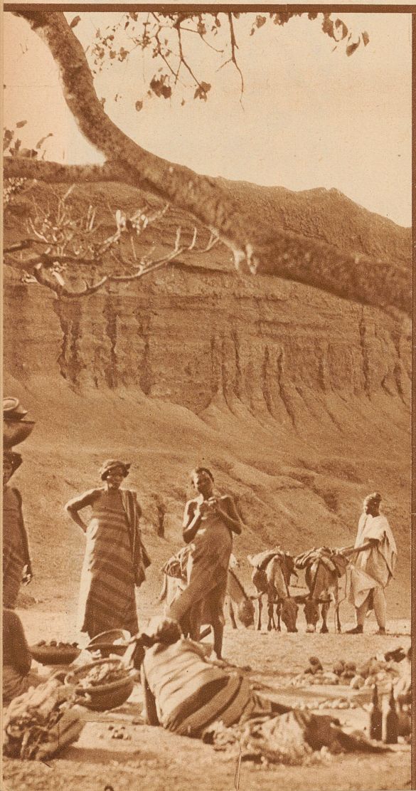
Handel am Fuße des Stadtwalls von Kano