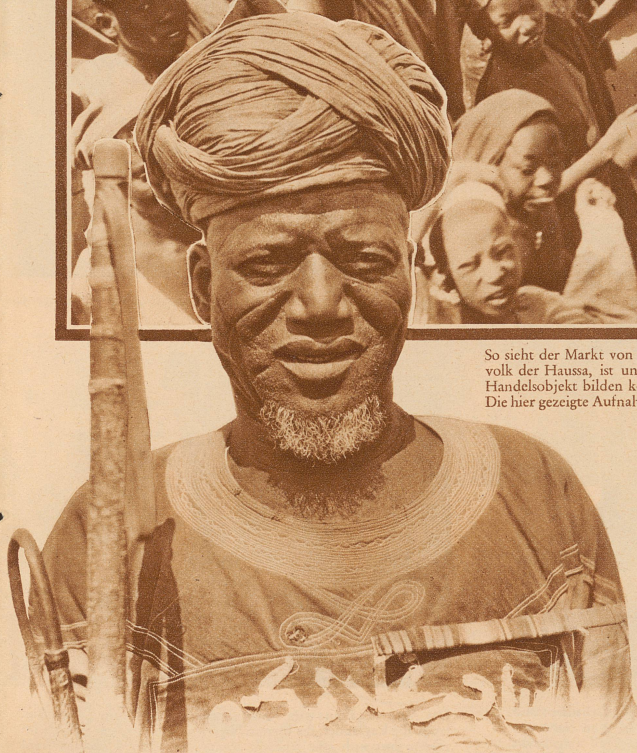
Mann aus der Leibgarde des Emirs von Kano, der als Polizist auf dem Flugplatz amtrete

So sieht der Markt von Kano aus. 50 000 Einwohner zählt diese größte Negerstadt Afrikas. Der Hauptteil der Bewohner, das reine Negervolk der Haussa, ist ungemein rührig, geschickt und vor allem handelslustig. Kein Gegenstand ist zu geringfügig, als daß er nicht ein Handelsobjekt bilden könnte, und wenn es nur ein paar armselige leere Flaschen sind, die der Besitzer zum Kaufe auf der Straße aufstellt. Die hier gezeigte Aufnahme war nur dadurch möglich, daß ich auf einen Verkaufstand hinaufkletterte, dessen trockene Lehmwände schließlich teilweise unter mir zusammenbrachen. — Die Neugier der Schwarzen ist unbeschreiblich, und wir genossen ein ungewöhnliches Ansehen. Besonders nachdem wir den Emir durch die Luft gefahren hatten, konnten wir nicht mehr im Auto durch die Menge fahren, ohne daß die Leute sich zum Gruß auf den staubigen Boden warfen