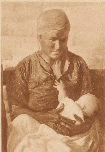
W. Jurawlew: Madonna aus dem Donezgebiet. Die schwarze Kohlenmadonna mit ihrem weißen Kindchen ist von einer primitiven, klaren Schönheit

Wir haben in der Schweiz begrifflicher Weise nur sehr selten Gelegenheit, mit eigenen Augen Sowjetkunst zu sehen. Man kennt wohl die Sowjetfilme, das Sowjet-Theater, angewandte Sowjetgraphik und das illustrierte Kinderbuch. Ueber die Sowjetmalerei war man dagegen fast gar nicht orientiert und man fragte sich: Existiert in der Sowjetunion überhaupt noch eine bildende Kunst, oder wurde sie von den Bürgerkriegsjahren und der schweren materiellen Not erstickt? In der Ausstellung des Kunstsalons Wolfsberg wird uns, zum erstenmal seit Bestehen der Sowjetunion, ein Einblick in die wenig bekannte Welt der Sowjetmalerei ermöglicht.