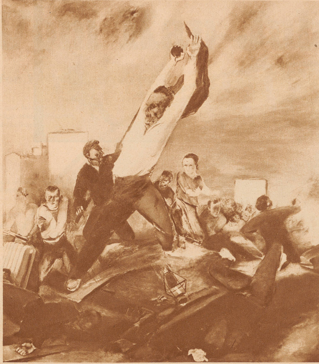
Koslow: Barrikadensturm aus der Revolution 1905. Bezeichnenderweise sind auf der Ausstellung Bilder revolutionärer Themen nur ganz selten vertreten. Fast alle beschäftigen sich mit dem Aufbau und dem werktätigen Leben