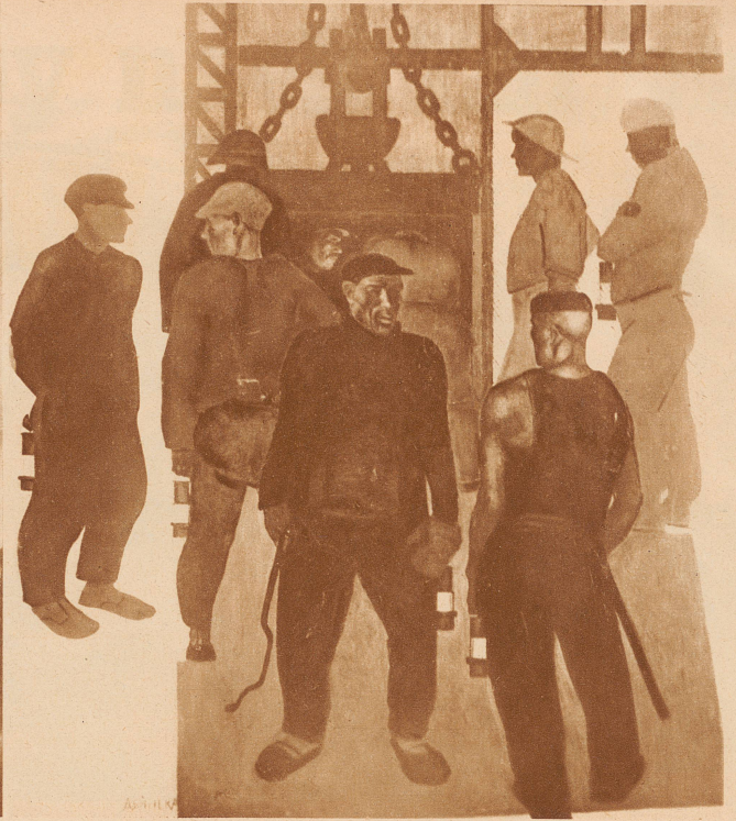
Deinoko: Bergarbeiter. Das ganz auf große Linien, einfache Kontraste aufgebaute Bild atmet eine herbe Freude an der Arbeit