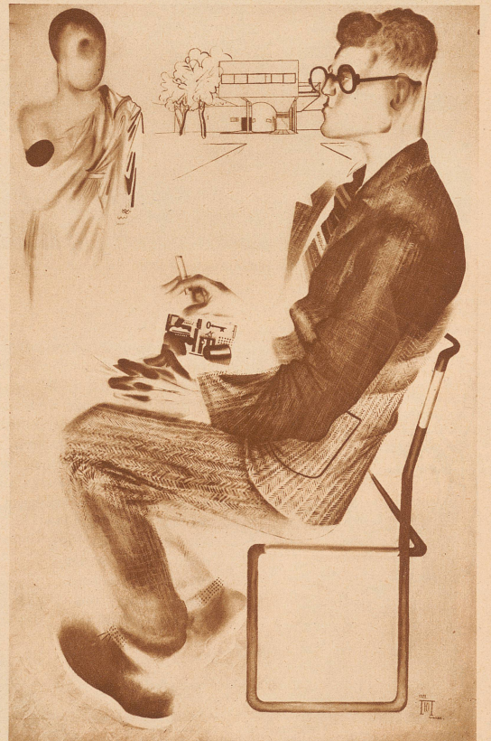
Pimenow: Der Architekt. Das Bild ist ganz in gelben, hellblauen und braunen Tönen gehalten. Im Hintergrund ein modernes Wohnhaus in den flachen Linien, wie sie jetzt große Mode in Rußland sind; die Corbusiersche Bauweise hat sich bei allen Neubauten durchgesetzt