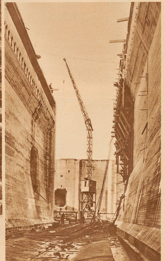
Aus hohen Betonwänden, die später dem Druck der Wassermassen standhalten können, wird die Riesenschleuse in Bremerhaven gebaut

wachsen aus unserer Erde empor, türmen sich von Jahr zu Jahr höher und höher. Auf ihrem Grunde rasen Autos, wie in den Straßenschluchten New Yorks; — strömt Wasser, wie in Kanälen und Schleusen. Kann es einem nicht Angst werden bei diesem Anblick? Ist es nicht die Vermessenheit der Erbauer des Turmes zu Babel, die in uns neu auflebt? Aber jene wollten nichts anderes, als herausfordernd kühn sein, — wir bezwecken letzten Endes nur das einfachste Glück der Erdenkinder: Brot und Freiheit von den Elementen.