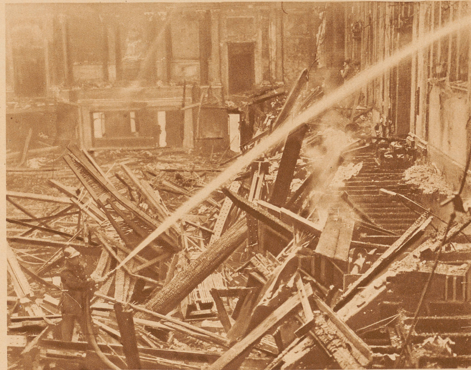
Eine Feuersbrunst zerstörte in London den Konzertsaal des Volkspalastes, die berühmte Queens Hall. Ein wirrer Trümmerhaufen bedeckt den Boden des einst so prunkvollen Gebäudes, in dem 2500 Personen Platz fanden

Eine neue Maschine zur Erlernung des Fliegens. Da sie in ihrer Beweglichkeit dem freifliegenden Flugzeug durchaus entspricht, bildet sie ein wertvolles Lehrmittel zur Instruktion. Der Fluglehrer (ganz links am erhöhten Pult) gibt dem Schüler Anleitungen mit Hilfe von farbigen Lichtsignalen, die am Schaltbrett des Führersitzes aufleuchten