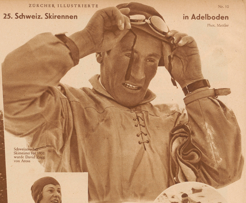
Schweizerischer Skimeister für 1931 wurde David Zogg von Arosa