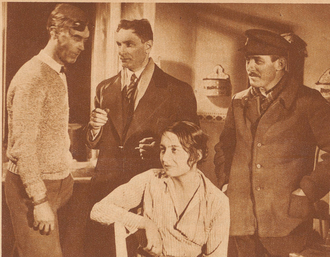
Die Präsens Film A.-G., deren erstes größeres Filmwerk «Frauenglück, Frauennot» seiner Zeit im Mittelpunkt des Interesses stand, dreht jetzt mit dem bekannten Regisseur Ruttman einen neuen großen Aufklärungsfilm. Der russische Regisseur Pudowkin, bei uns durch seinen Film «Sturm über Asien» bekannt geworden, interessierte sich für die Aufnahmen und besuchte Ruttman im Filmatelier. Von links nach rechts: Regisseur Ruttman, Pudowkin, zwei Darsteller