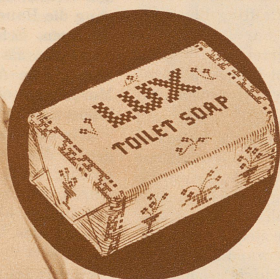
LTS 53-098 5 G

Sie müssen nun wirklich einen Versuch mit dieser Seife machen – nur einmal – und dann werden Sie gewiss keine andere Seife mehr verwenden. Die Eigenschaft, dem Teint das vielbewunderte, jugendfrische Aussehen zu verleihen, hat die Herzen aller Frauen erobert und darum ist Lux Toilet Soap auf der ganzen Welt so rasch populär geworden. Sie werden gewiss entzückt sein von der Wirkung dieser Seife und erstaunt, dass eine so luxuriöse Toilettenseife zu einem so billigen Preise zu haben ist. Also, machen Sie heute noch einen Versuch!