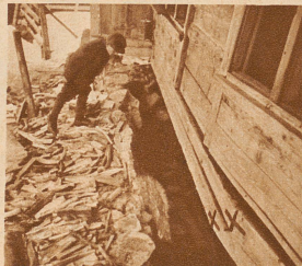
Der Boden rutscht unter dem Haus weg und bringt den Keller ans Tageslicht