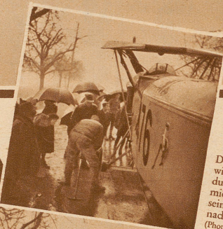
Der Flugzeugrumpf wird mit dem Landungssparren am Camion befestigt und auf seinen eigenen Rädern nachgezogen