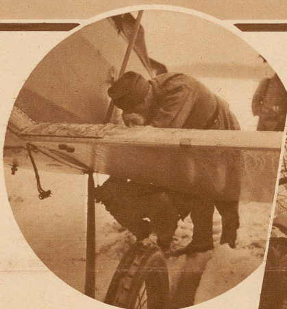
Das DH. 5-Flugzeug mußte bei Herzogenbuchsee notlanden. Zum Abtransport mußten die Tragflächen demontiert werden

Zum Wiederholungskurs der Fliegerkompanie 9, die in Thun einrückte, wurden die Flugzeuge von Dübendorf, wo sie stationiert sind, nach Belp geflogen. Ein Apparat mußte bei Herzogenbuchsee wegen starkem Nebel auf einer überschnitten und verwässerten Wiese notlanden. Wieder zu starten war wegen des schlechten Bodens unmöglich. Das Flugzeug wurde demontiert und durch Bern nach Belp geschleppt. Die anderen Apparate waren inzwischen nach Belp gelangt, wo von der Mannschaft Zelt-Hangars aufgestellt worden waren. Aber auch hier verursachte der außerordentliche Schneefall vom 7., 8. und 9. März große Schwierigkeiten. Die Flugzeuge mußten mit Hilfe von Pferden in die Hangars gebracht werden.