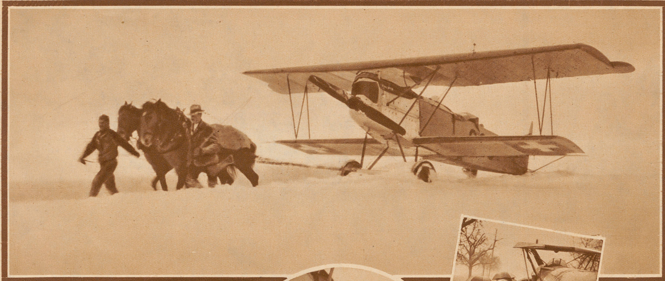
Mit zwei P. S. werden in Belp auf dem Flugplatz der «Alpar» die Fokker in die Hangars geschleppt