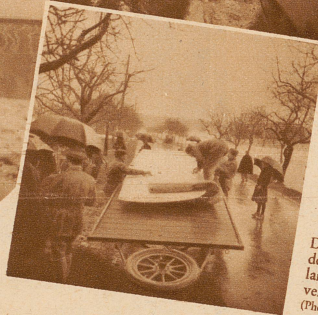
Die Tragflächen werden auf dem 5 Meter langen Flügelwagen verstaub