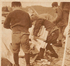
Die Schulbuben suchen ihre Hefte und Bücher aus dem Gerümpel der geräumten Häuser