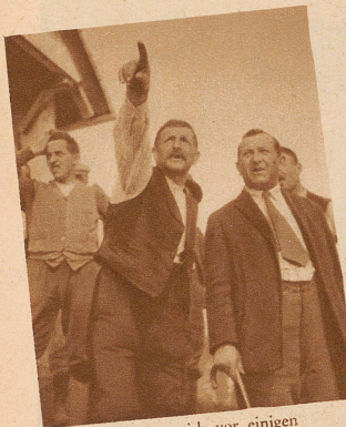
Da oben zeigten sich vor einigen Tagen ein paar kleine Risse. Heute sind sie meterbreit

Zusammenstehend: Die unterste Partie der Rutschung. Schnee, Eis, Lehm und der zerrissene Wald bewegen sich langsam dem Graben des Schwarzwassers zu