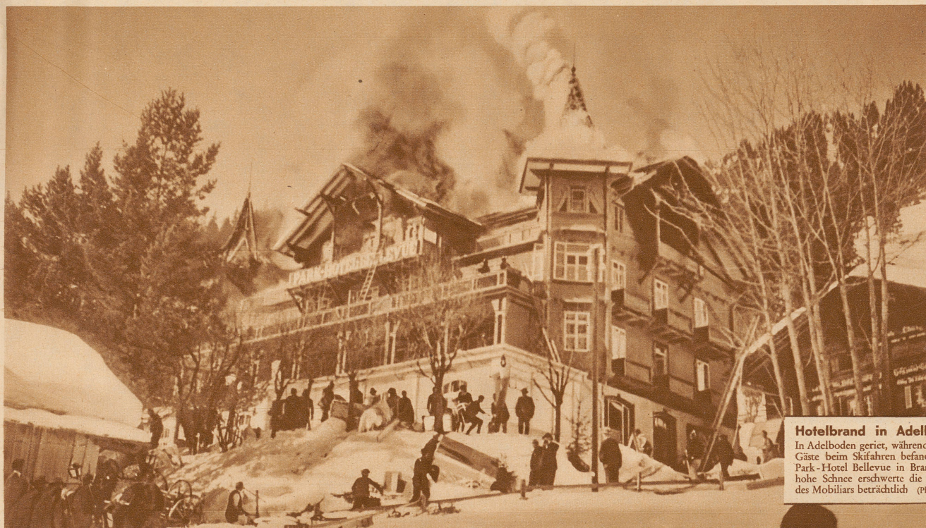
Hotelbrand in Adelboden In Adelboden geriet, während sich die Gäste beim Skifahren befanden, das Park-Hotel Bellevue in Brand. Der hohe Schnee erschwerte die Rettung des Mobiliars beträchtlich