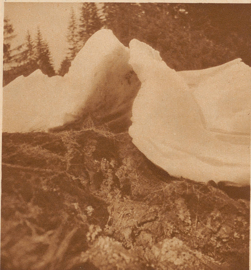
Die Schneedecke wurde zusammengeschoben wie ein Tischtuch und bildet meterhohe, wellenförmige Aufstöße