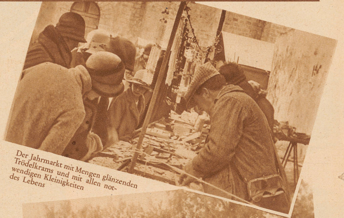
Der Jahrmart mit Mengen glänzenden Trödelkrams und mit allen notwendigen Kleinigkeiten des Lebens

man den billigen Wein. — Auch bei den Zigeunern ruht man noch lange nicht. Da ist Madame Zarechou, die beste Wahrsagerin im Lager. Zu ihr kommen Brautpaare oder verschleierte Damen, dem eigenen Auto entstiegen, arme Verliebte und reiche Verliebte oder Neugierige, die sich den Zukünftigen oder ein großes Eheglück mit Reichtum und vielen oder auch wenigen Kindern aus der Hand lesen lassen.