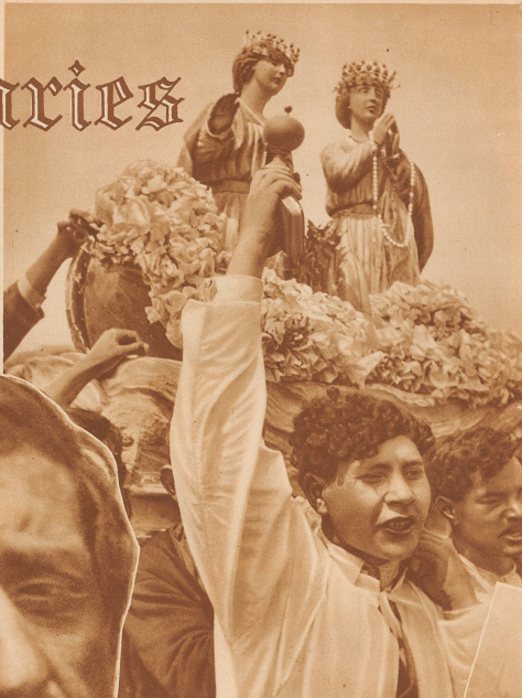
Die Gnadenbilder werden in großer Prozession durch die Straßen des Seefischers zum Meer getragen. Hoch auf den Schultern der betenden Provencalen schweben die Marien von Bünnen umgeben unter dem seltsamen Himmel über den Köpfen der Menge dahin.

St. Marias ist ein kleines Fischerdorf drüben ganz im Süden Frankreichs, wo die Rhone in das Meer mündet. Dort in der Camargue, wo die Herden der feurigen weißen Pferde und der wilden schwarzen Stiere in freier Steppe weiden, wo einsam in den kleinen Bretterhütten die Gardiens, ihre herrischen Hirten, haasen, nicht in brechender Sonne die uralte Burgkirche von St. Marias-de-la-Mer. Sie ist wie eine Festung gebaut, mit dicken Mauern und einem Wehrgang hinter Zinnen, denn sie mußte einst gegen maurische Seeräuber vertheidigt werden.