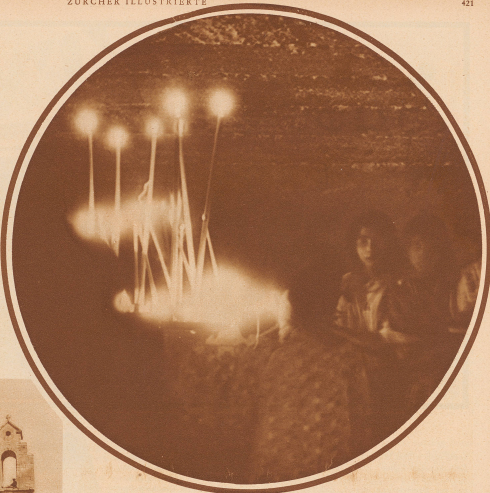
Unten in der Krypta der Kirche besuchen die Zigeuner den Sarkophag der schwarzen Sarah. Das flackernde Kerzenlicht, die dunklen Gesichter, die Gebete, all das irrtümlich nicht nach dem kühnen Angekommenen in den Barm und zwingt ihn zur inneren Teilnahme

Die Menschen sinken in die Knie; nicht enden will das Rufen und Schreien, wenn die Särge des Hochaltars berühren. Alles drängt nun wild dorthin, um eine Blume zu erhaschen und die Lippen an den heiligen wunderkräftigen Schrein zu pressen; und während dies im Kirchenschiff die Bürger Rosenkränze weben, drängen sich unten in der Krypta die Zigeuner um den Sarkophag der schwarzen Sarah, die ihnen Glück bringen soll. Hier werden Dolche gewetzt und Armreifen, ein Schlipps, eine Mütze, ein Goldbeutel, Ketten und Pferdegeschirre. Auch feiern hier die jungen Paare einzeln Stämme ihre