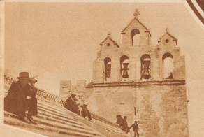
Die Burgkirche von St. Marias-de-la-Mer

Flackernde Kerzen beleuchten magisch den Raum, der erfüllt ist vom Dunst der Massen. — Kopf an Kopf stehen die Menschen, die Frauen mit ihren Säuglingen neben Männern und Kindern; Zigeuner neben christlichen Bürgern harrten hier stundenlang, bis das Hochamt und die Predigt des Erzbischofs von Aix zu Ende sind. Die Menge beginnt, heilige Lieder zu singen. Vom brausenden Jubel der Massen begrützt werden die Reliquienscheine langsam, Zentimeter für Zentimeter, an blumengeschmückten Tauen aus der Höhe herabgelassen.