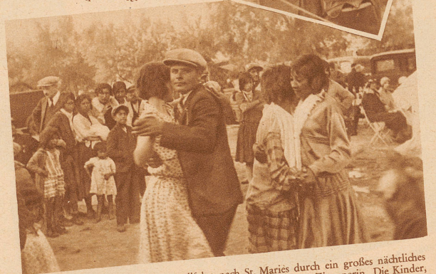
Die Zigeuner beschließen ihre Wallfahrt nach St. Maries durch ein großes nächtliches Tanzfest: jeder tanzt, vom 7jährigen Mädchen bis zur uralten Zigeunerin. Die Kinder, in Ekstase geraten, ruhen nicht cher, als bis sie der Vater aus dem Kreis holt