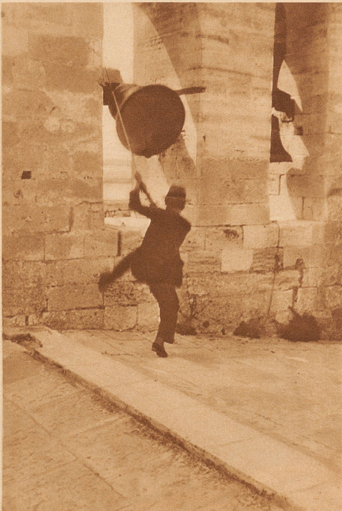
Die Glocken der Burgkirche