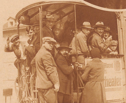
Bern hatte eine freundeigenössische Invasion zu verzeichnen. Ueber 20000 Zuschauer reisten nach dem Stadion Wankdorf. Die Berner Verkehrsmittel waren voll beschäftigt

Rechts im Kreis: Eine Viertelstunde vor Schluß das erste Tor! 1:0 für die Schweiz. Bravo! Hurrah!