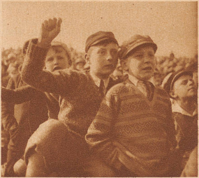
Die Berner Buben waren auch tüchtig bei der Sache. Sie schimpften, wenn etwas fehlging und schrien, wenn's geriet. «D'Schwiz isch guet», meinten sie