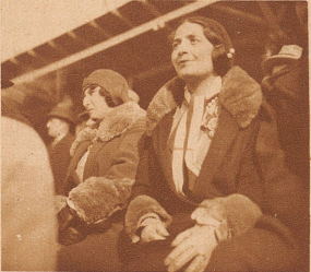
Man bemerkte in der Zuschauermenge manche schöne italienische Frau, die dem Spiel mit besonderer Hingabe und Anteilnahme folgte

Die Italiener glänzen durch intelligentes und diszipliniertes Zusammenspiel. Pasche, der Schweizer Torwart, ist aber auf der Hut. Wir sehen ihn hier bei einer seiner ausgezeichneten Abwehrtaten