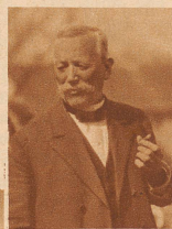
Wehmütig blickt der Herr Pfarrer auf die Reste seiner Kirche, in der er so oft das Wort Gottes gepredigt hat