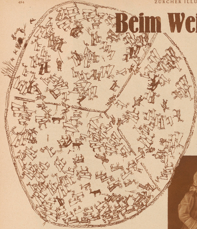
Eine Zeichnung Johan Turis, des Weisen von Lappland, eine Rentierherde in einem Pferd darstellend