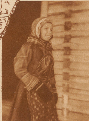
Laplandmädchen am Torneträsk-See