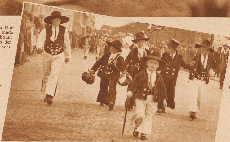
Der Kinderumzug liefert jedes Jahr frischen Nachwuchs an Hamburger Zimmerleuten