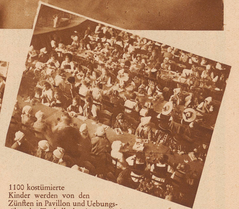
1100 kostümierte Kinder werden von den Zünften in Pavillon und Uebungssälen der Tonhalle bewirtet. Die bunte Gesellschaft gleicht von oben einer blumenübersäten Wiese