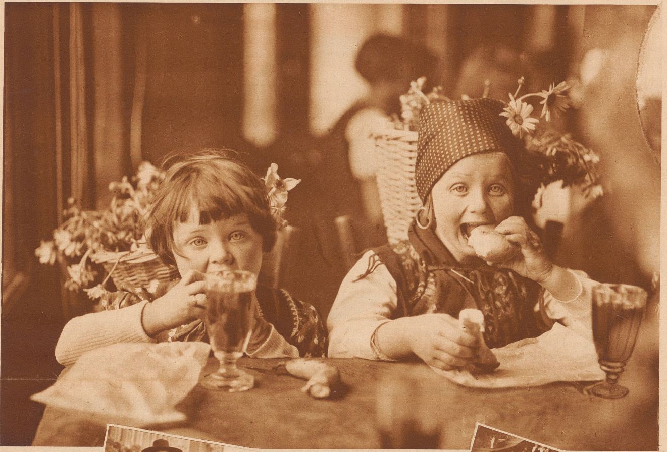
Die Kinder haben im Umzug durch die Stadt müde Beine bekommen. Doch zum Schluß winkt ihnen in der Tonhalle ein erfrischendes Bratwurstbankett