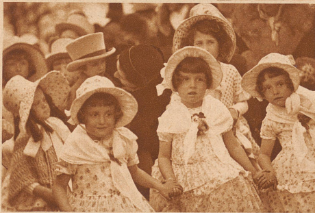
Das Publikum kann sich an zierlichen Biedermeierlis nicht genug satt sehen