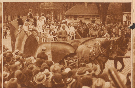
Der dekorative Wagen der Gruppe «Blueme vo heime uf Wise und Feld» hat die Bestimmung, alle Müdegefahrenen, die nicht mehr weitermögen, aufzuladen