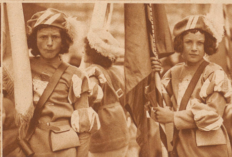
Zwei stramme Fährliche aus der Fahngruppe der 22 Kantone