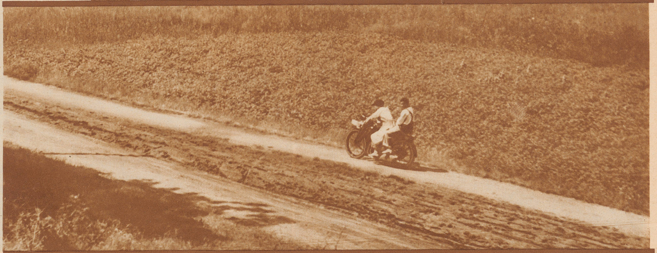
Sonntagsglück auf der Landstraße