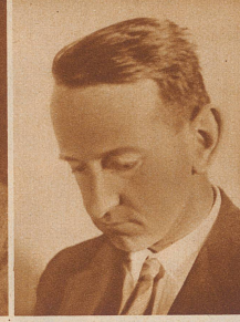
«Vetter Hans», Bern

einer der besten Schweizer Lyriker, ein weitgereister, vielgelesener Schriftsteller und Mitarbeiter mehrerer Zeitungen und Zeitschriften im In- und Ausland, schrieb den „Spitzbergen-Sommer“, sechs Bände lyrischer Gedichte und eine Reihe geologisch-geographischer Arbeiten