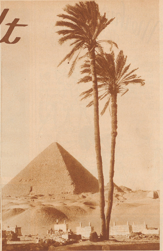
Die Pyramiden von Gizeh in Aegypten gehören zu den größten Pyramiden der Welt. Die größte ist 218 Meter hoch. Ihr könnt euch denken, daß Niki, dieser Träumer, einige Zeit gebraucht hätte, bis er wieder auf dem Boden angelangt wäre

Liebe Kinder! Der Niki weiß schon, was eine Pyramide ist. Der Lehrer hat ihm in der Geometriestunde eine große Pyramide aus Holz gezeigt, die war braungebeizt und spiegelglatt. Niki träumte sogar in der Nacht davon. Aber er träumte von einer richtigen Pyramide mitten in der Wüste. Diesen Traum muß ich euch erzählen, so merkwürdig ist er.