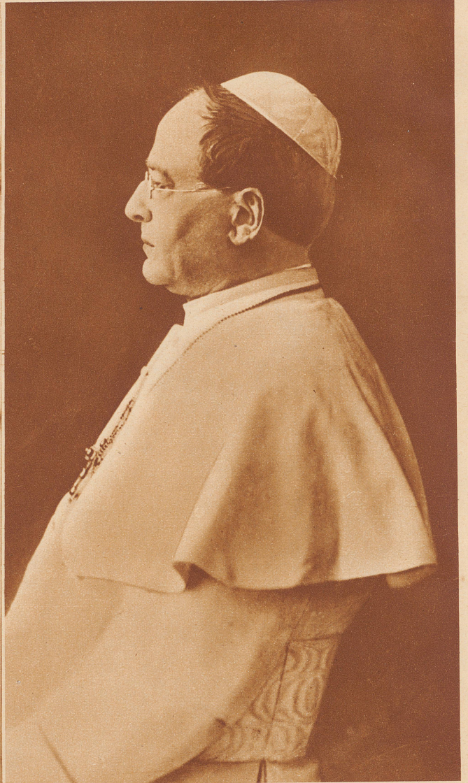
Papst Pius XI.

Es sind etwas mehr als zwei Jahre her, daß der Kirchenstaat wieder hergestellt worden ist und «auf ewige Zeiten» Frieden zwischen dem Heiligen Stuhl und dem Königreich Italien geschlossen wurde. Aber dieser Friede war nicht von langer Dauer. Schon nach einem Jahr entstanden Reibereien zwischen dem Vatikan und Mussolini, die nie mehr ganz aufhörten. In den letzten Tagen hat der Konflikt sich verschärft und man kann gespannt sein, was für ein Ende dieser Streit finden wird.