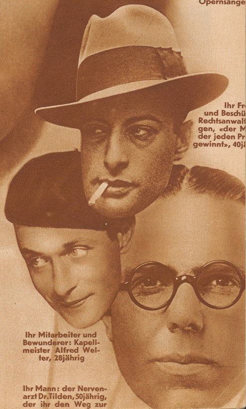
Ihr Fr und Beschü Rechtsanwalt gen, «der M der jeden Pr gewinnt», 40j