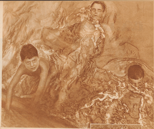
Bild links: Kilometer 1: Zwei Wege führen ins Wasser. Der Bedrückte steigt die bemoozten Sandbänke hinauf, um sich mit der großen Zelle die Temperatur des Wassers. Der Kühne aber stürzt sich mutig vom Fels in die Fluten.