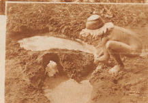
Kilometer 3: Die Kinderparade in den Aeren spielen können die Kleinen geteilt spielen und sich nach Herdentrot vorwärts.