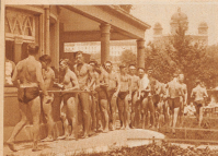
Kilometer 0: Das Eisbaden in Bern, und im demokretischen Kleidungsstück, die Badelinge, ebnelt sich der Berner. Steigt er aus dem kalten Aerenwasser, so gröhelt er sich gerne im «Allobrothron» ein Glas Milch oder Seltwasser, ein Teller warme Suppe und ein gewichtiges Stück Brot.