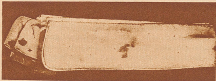
Leinener Kragen, im britischen Imperial War Museum in London aufbewahrt, der als Schreibmaterial für Geheimtinte diente

Wenn heute in manchen Büchern, die sich mit der Spionage befassen, von dem «kindlichen Mittel der unsichtbaren Tinte» geschrieben wird, so kann man getrost entgegennehmen, daß die meisten Spione trotz alledem dieses «kindliche Mittel» benützt haben. Im britischen Imperial War Museum, wo eine ganze Reihe sehr interessanter Dokumente der Spionage ausgestellt sind, sieht man einen weichen Kragen, den ein deutscher Spion als Schreibmaterial benutzte. Er schrieb seine Nachrichten mit unsichtbarer Tinte darauf. Ein anderer Spion benutzte einen präparierten Talkumpuder zum Schreiben, ein dritter verwahrte seine Geheimtinte in einer Mundwasserflasche. Sehr interessant ist ein Stück Seife, das ebenfalls im Londoner Museum zu sehen ist.