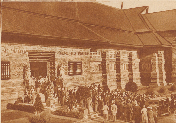
Der neuerbaute holländische Pavillon an der Pariser Kolonialausstellung. In der kurzen Zeit von sechs Wochen ist der durch Feuer zerstörte Prachtbau der Holländer aus der Asche wieder erstanden