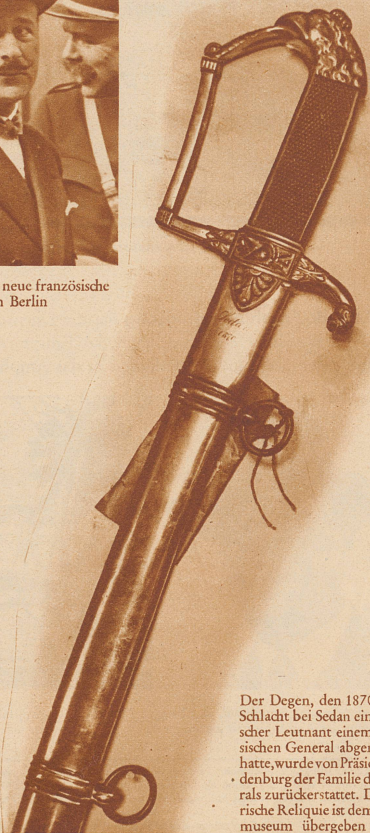
Der Degen, den 1870 bei der Schlacht bei Sedan ein preussischer Leutnant einem französischen General abgenommen hatte, wurde von Präsident Hindenburg der Familie des Generals zurückerstattet. Die historische Reliquie ist dem Armeemuseum übergeben worden