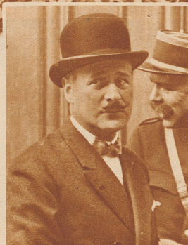
François Poncet , der neue französische Botschafter in Berlin

In Madrid trafen sich zu wichtigen politischen Besprechungen der Präsident der spanischen Republik, Alcañ Zamora (links) und der Präsident von Katalonien, Oberst Macià (rechts). Oberst Macià ist der geistige Führer der katalonischen Separatisten, deren Ziel darin besteht, Katalonien zu einer selbständigen Republik zu erheben