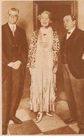
Ricarda Huch, die größte Dichterin der Jetztzeit, erhielt als erste Frau den Goethepreis der Stadt Frankfurt, der vor ihr dem Philosophen Leopold Ziegler, Sigmund Freud, Albert Schweitzer und Stefan George verliehen worden war. Ricarda Huch hat in Zürich studiert und war als Lehrerin an der Höheren Töcherschule tätig

Die «Zürcher Illustrierte» erscheint Freitags • Schweizer Abonnementspreise: Vierteljährlich Fr. 3.40, halbjährlich Fr. 6.40, jährlich Fr. 12.—. Bei der Post 30 Cts. mehr. Postscheck-Konto für Abonnements: Zürich VIII 3790 • Auslands-Abonnementspreise: Beim Versand als Drucksache: Vierteljährlich Fr. 4.50 bzw. Fr. 5.25, halbjährlich Fr. 8.65 bzw. Fr. 10.20, jährlich Fr. 16.70 bzw. Fr. 19.80. In den Ländern des Weltpostvereins bei Bestellung am Postschalter etwas billiger. Insertionspreise: Die einspaltige Millimeterzeile Fr. —.60, fürs Ausland Fr. —.75; bei Platzvorschrift Fr. —.75, fürs Ausland Fr. 1.—. Schluß der Inseraten-Annahme: 14 Tage vor Erscheinen. Postscheck-Konto für Inserate: Zürich VIII 15769