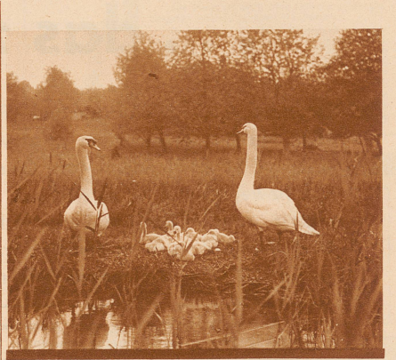
SCHWANE AM HALLWILER SEE

Wie diese Schwäne ihre Brut beschützen, so wachen kundige Hände über die Herstellung einer stets guten Qualität der bekannten Hallwiler Forellen 10 CTS. CIGARRENFABRIK M. G. BAUR BEINWIL AM SEE. GEGR. 1860 SUP 15 CTS.