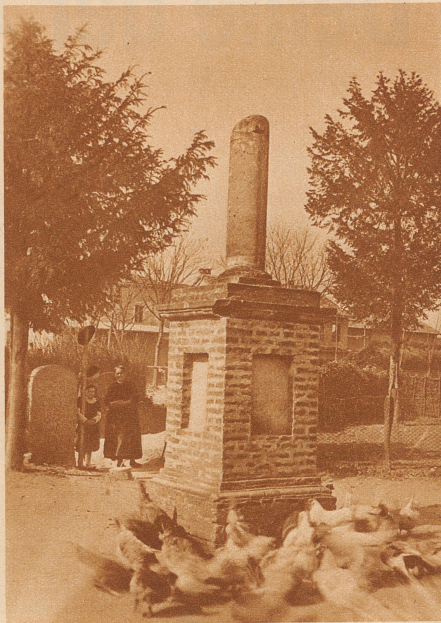
Das Schlachtdenkmal von Marignano im Hühnerhof eines Gutes beim Weiler Zivido

Gewaltig war der Aufstieg gewesen, über Morgarten, Sempach, Näfels und die Burgunderkriege, die den Kriegsruhm unserer Vorfahren über ganz Europa verbreiteten; und erst der Schwabekrieg, wo es ihnen gelang, sich die tatsächliche Unabhängigkeit vom Deutschen Reich mit den Waffen zu erzwingen! Dann folgten die italienischen Kämpfe, wo die eidgenössischen Söldner im Dienste Frankreichs und des Papstes, im Dienste Mailands und italienischer Potentaten Sieg um Sieg erfochten, so daß es genügte, Schweizer im Heere zu haben, und man war seiner Sache sicher. Die alte Eidgenossenschaft ist damals trotz des kleinen Gebietes, das zu ihr gehörte, die bedeutendste militärische Großmacht gewesen, — bis in Marignano plötzlich und unver-