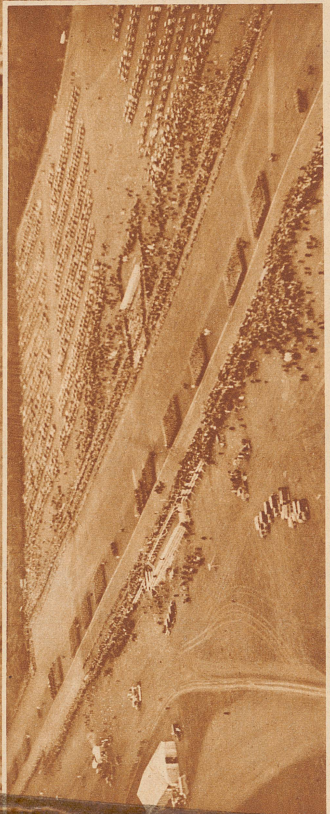
Bild rechts: Die grauen Karrees der Infanterie-Kompagnien marschieren an der Tribüne (links Mitte) vorbei. Circa 60.000 Zuschauer waren zur Stelle, im Hintergrund ein Autopark von etwa 2000 Wagen. Die Truppen marschieren in Reihen von links nach rechts unten. Das große Bild links oben zeigt die gesamte Parade. Man denke man sich links an kleinere Bild anschließend