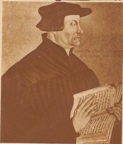
Huldrych Zwingli, der große Schweizer Reformator, begann seine reformatorische Tätigkeit am Zürcher Grossmünster, als Leutpriester, — d. h. soviel wie Stadtpfarrer, Priester für die Leute