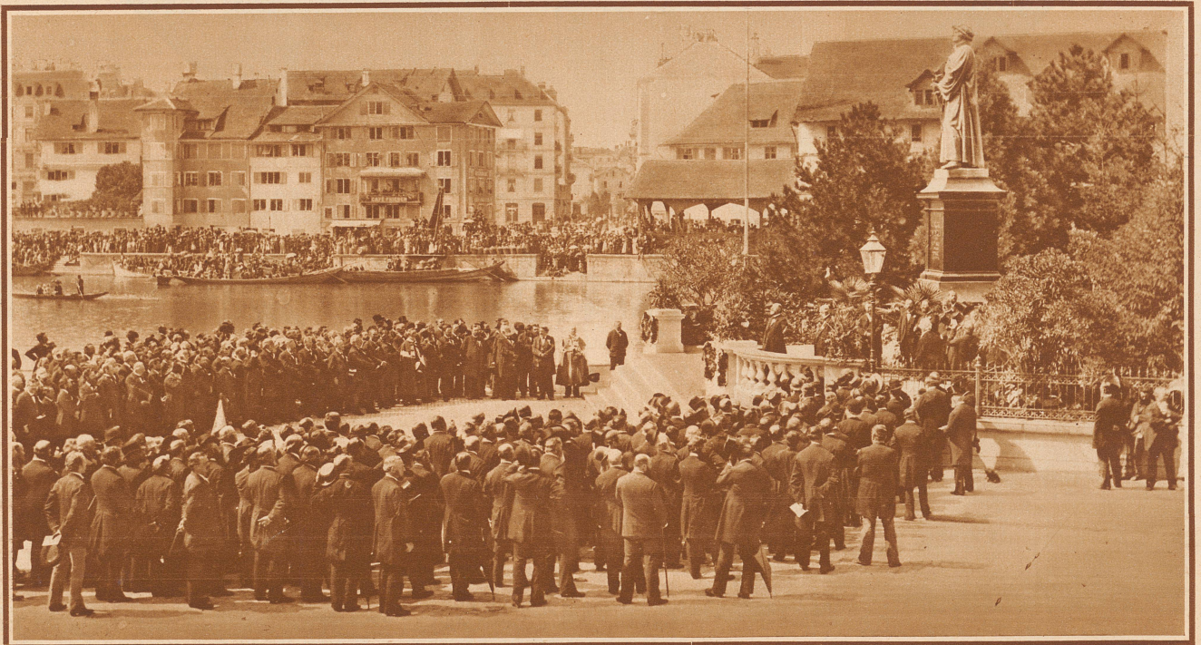
Eine historische Foto: die Einweihung des Zwingliedenkmal vor der Wasserkirche in Zürich am 11. Oktober 1881, vor fünfzig Jahren

In dieser Stellung wirkte er dann das nächste Jahr für seine Reformation: es blieb ihm nun mehr Muße zu Studium und literarischer Tätigkeit. Denn jetzt erst folgten die eigentlichen, schwersten Kämpfe nach allen Seiten: im Stift gegen eine kleine, aber heftige Opposition; in der Stadt gegen die Anhänger des alten Glaubens; in der Eidgenossenschaft gegen ebendieselben und sonstige Feinde genug; und