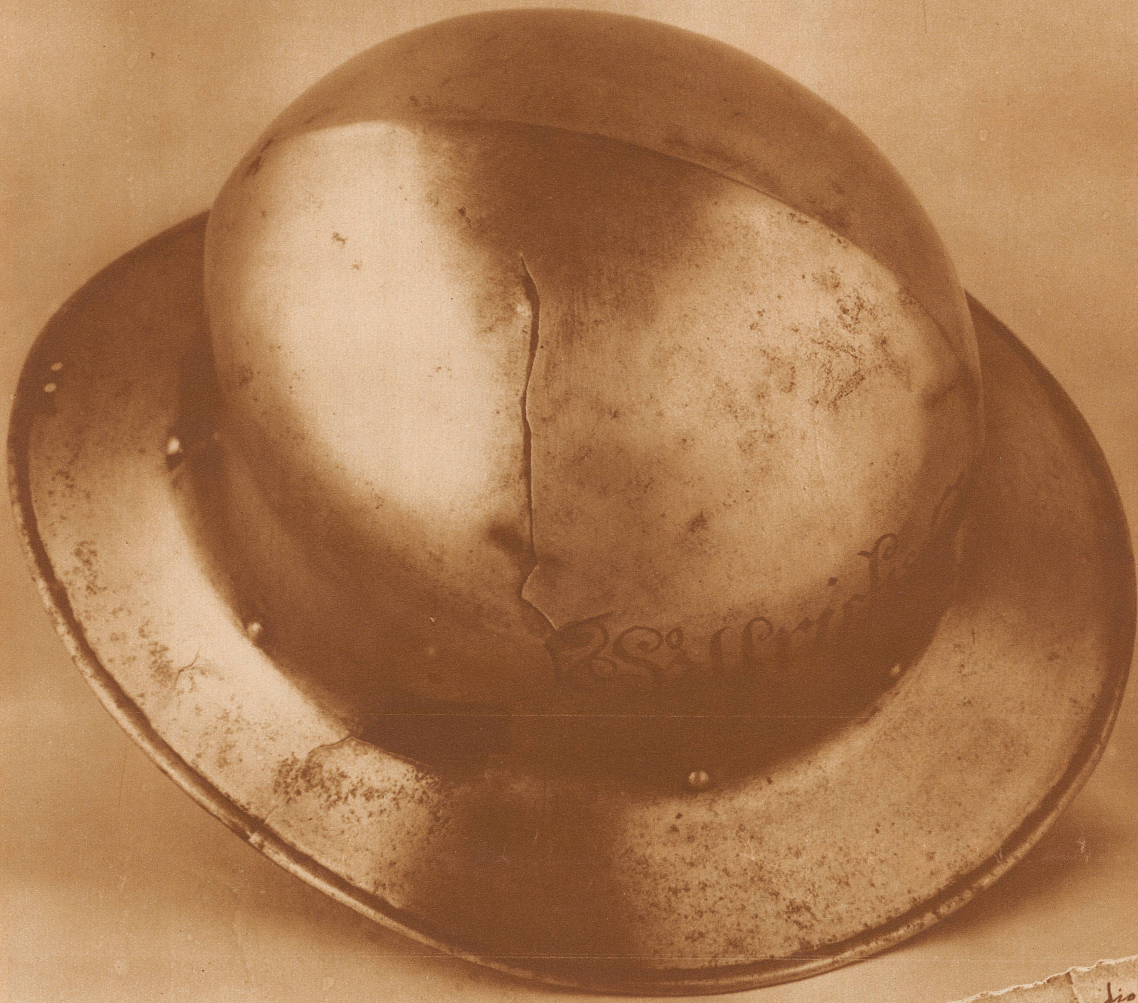
Zwingli's Helm, den er in der Schlacht von Kappel trug: durch das Loch, welches man hier so deutlich sieht, drang eine schwere Schlagwaffe und verletzte den Zürcher Feldprediger tödlich.

selbst im Deutschen Reich, gegen ... Luther! — Doch wenigstens im Stifte gelang es dem entschlossenen Reformator, die Mehrheit des Kapitels für sich und seine Ideen zu gewinnen, und unter seiner Führung anerbot sich schon im September 1523 eine Botschaft des Propstes und Kapitels vor dem Zürcher Rat, freiwillig auf gewisse unbegründete Einkünfte zu verzichten. Auch sollte ein namhafter Abbau der Stiftsgeistlichen vorgenommen werden und aus dem Ertrag der unbesetzten Pfründen wollte man die Pflege des höhern Unterrichts fördern.