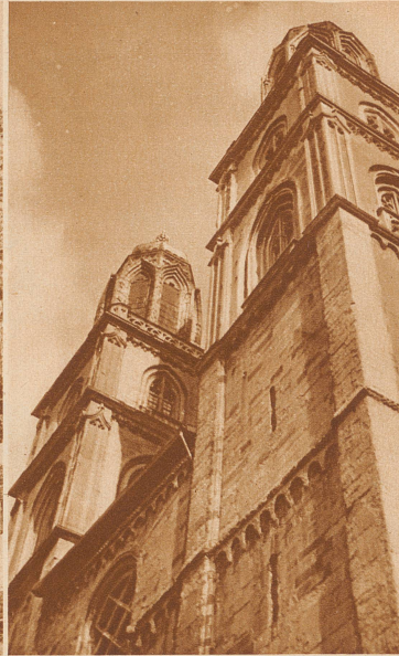
während sie heute mit charakteristischen neugotischen Kuppeln aus dem letzten Jahrhundert eingedeckt sind.