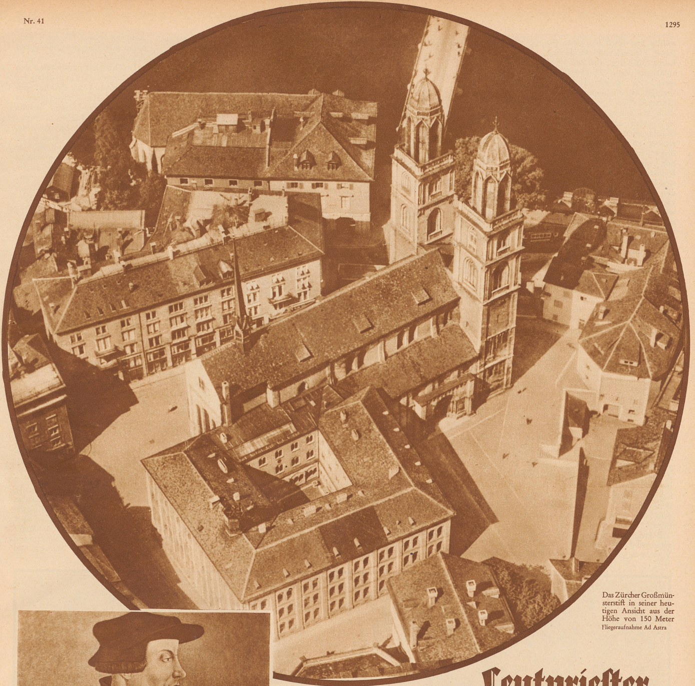
Das Zürcher Grossmünsterstift in seiner heutigen Ansicht aus der Höhe von 150 Meter