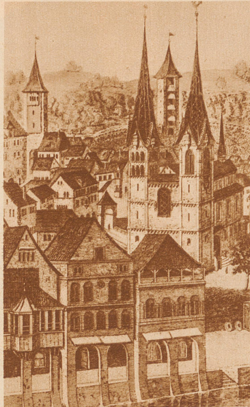
So präsentierte sich das Großmünster zur Zeit Zwinglis: die Türme trugen noch hohe Spitzhelme, . . .

Begreiflicherweise erregte das ungeheures Aufsehen und zog Huldrych Zwingli bald genug das Verlangen seines Bischofs in Konstanz zu, ein der-