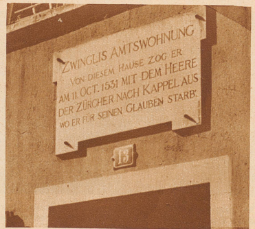
Inschrift an Zwingli's letzter Amtswohnung: Kirchgasse 13. Das Haus war der Sitz des Großmünsterschulhern und hieß deshalb die Schulci.