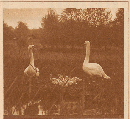
SCHWÄNE AM HALLWILER SEE

Wie diese Schwäne ihre Brut beschützen, so wachen kundige Hände über die Herstellung einer stets guten Qualität der bekannten Hallwiler Forellen