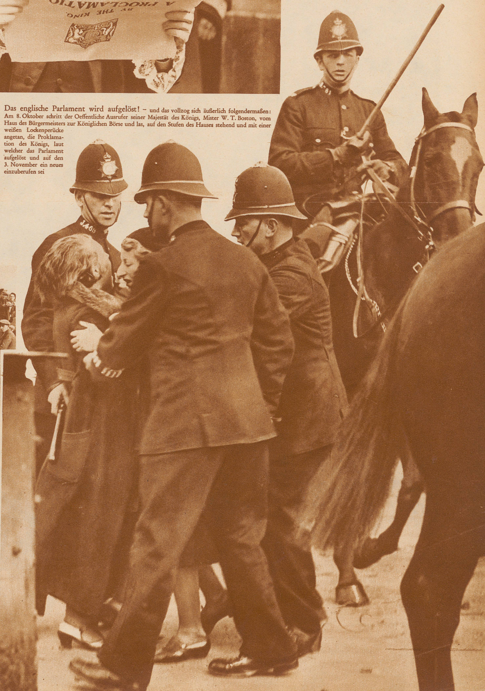
Bild rechts: Vier Polizisten zu Pferd und zu Fuß bemühen sich, zwei Demonstrantinnen, die sich wild wehren, abzuführen