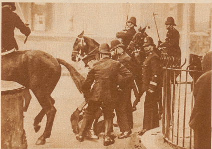
Ein Demonstrant wird von der Polizei überwältigt und verhaftet