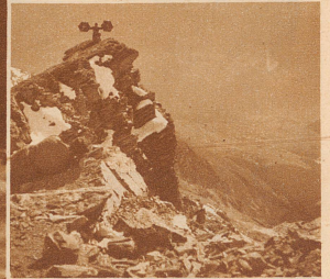
Signalmann der Hochgebirgspatrouille des Geb.-Infanterie-Bat. 93 auf dem Gipfel des Lenzerhorn