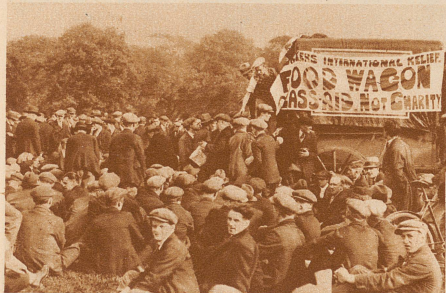
Massen-Meeting der Internationalen Arbeiterhilfe im Hyde-Park in London. In ununterbrochener Folge sprechen während des ganzen Tages Redner über die Lage und die Hilfsmöglichkeiten. Da die Zuhörer aus allen Teilen der Riesenstadt zu Fuß herbeieilen und bis spät am Abend blieben, wird in einem improvisierten Küchenwagen Suppe und Kartoffeln gekocht und gratis an die Arbeitslosen abgegeben

Das englische Parlament wird aufgelöst! - und das vollzog sich äußerlich folgendermaßen: Am 8. Oktober schritt der Öffentliche Ausrufer seiner Majestät des Königs, Mister W. T. Boston, vom Haus des Bürgermeisters zur Königlichen Börse und las, auf den Stufen des Hauses stehend und mit einer weißen Lockenperücke angetan, die Proklamation des Königs, laut welcher das Parlament aufgelöst und auf den 3. November ein neues einzuberufen sei