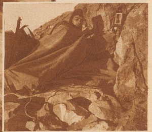
Nacht-Biwak nahe der 3000 Meter-Grenze auf dem Lenzerhorn. Auf hergerichteter Steinlager, in die Zeltsäcke gehüllt und angeleitet, verbrachte die Hochgebirgspatrouille des Geb.-Inf.-Bat. 93 eine Manövernacht