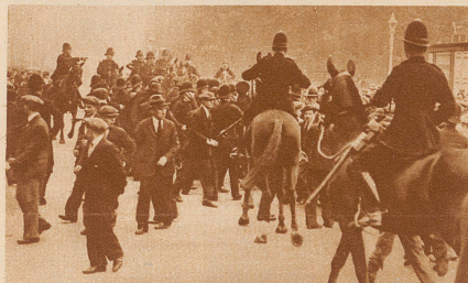
Berittene Polizei geht gegen die Teilnehmer an einer Arbeitslosen-Demonstration vor

Vor zwei Wochen schloß der britische Schatzkanzler Snowden seine große Budgetrede im Parlament mit den emphatischen Worten: «England yet will stand!» «England soll nicht untergehen!» Seither hat jeder Tag dem britischen Reich neue Sorgen und Erschütterungen gebracht: Die Auflösung des Parlaments, Demonstrationen der Arbeitslosen gegen die beabsichtigten Reduktionen der Stempelgelder, Verhaftung einzelner Demonstranten und als Folge davon neue ernste Arbeiterunruhen, die bis ins Herz der Stadt, vor das Parlament und das Mansion House drangen.