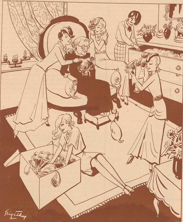
Federn wieder die große Mode. Großmutter wird gerufen