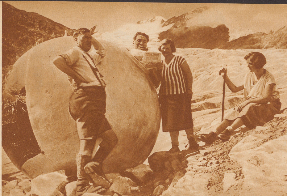
Streit um Piccards Gondel. Um die Aluminiumgondel Professor Piccards, die seit dem denkwürdigen Stratosphärenflug im Mai dieses Jahres auf dem Gurgler Ferner liegt, ist ein Streit entstanden. Verehrer Piccards in Brüssel möchten die Reliquie auf dem Gletscher bergen und sie nach Belgien in ein Museum bringen, die Bewohner von Gurgl wollen sie nicht hergeben, da sie für den Ort eine große Sehenswürdigkeit und ein gutes Lockmittel für fremde Besucher geworden ist. Unser Bild zeigt die Gondel auf dem Gurgler Ferner mit einer Anzahl Touristen