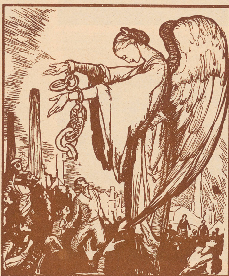
So sieht es England selbst: Das Volk zerbricht die Ketten der Goldwährung, mit denen die Industrie gefesselt war